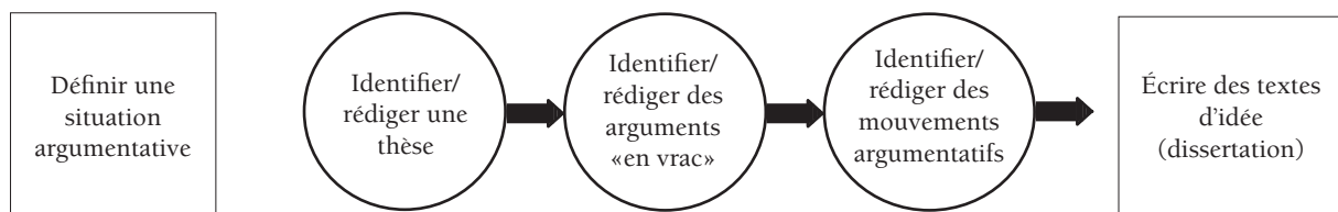
Figure 1. Schéma de la suite d'activités de TO16.

Ces schématisations des suites d'activité des séquences TO16, TO07 et TO05 rendent compte des priorités choisies par trois enseignants. Ces schémas ne valent que pour les trois occurrences singulières attestées par l'empirie. Mais c'est la comparaison de ces occurrences avec l'ensemble de la collection qui permettra de donner sens aux séquences d'enseignement et de donner à voir, par la récursivité d'une structure, des pratiques sédimentées.