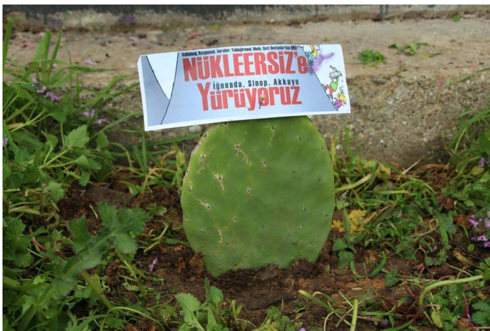
Cladode de figuier de barbarie, porteur de valeurs écologistes (bostan de Moda Gezi) Le slogan est un jeu de mot sur le sens du verbe yürümek (marcher, aller vers). On peut ainsi traduire la pancarte à la fois par « Nous défilons contre le nucléaire » et « Nous allons vers un monde sans nucléaire » (01.03.2015)