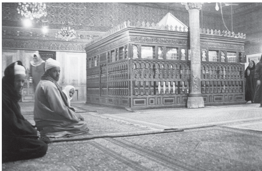
Intérieur du mausolée de l'imam al-Châfi'î

Bien entendu, cette spécialisation des saints n'est pas exclusive à l'islam. Elle est attestée également dans le christianisme (Delumeau, 1989). Chez les coptes,