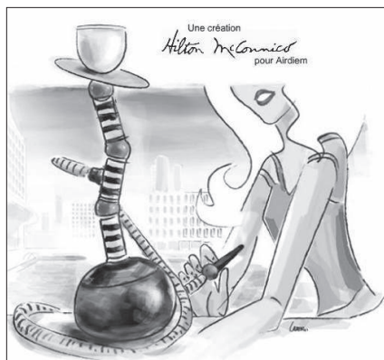
Le narguilé d'Airdiem pour les femmes parisiennes

Au passage, des biais relatifs aux représentations de l'Autre sautaient aux yeux. Certaines interdictions ne sont pas sans rapport avec le caractère « ethnique » et l'image « négative » de l'objet. Dès le début des années 1990, la Tunisie bannissait la pratique sur les terrasses des cafés. Dans l'esprit des responsables, les raisons relevaient probablement de la supposée mauvaise image que donneraient les habitants de ce pays aux millions de touristes qui le visitent chaque année. En Thaïlande, où vit une minorité musulmane souvent en conflit ouvert avec l'autorité centrale, la décision politique d'interdiction totale fut prise en 2003 en prenant pour caution scientifique l'un des articles alarmistes. En Israël,