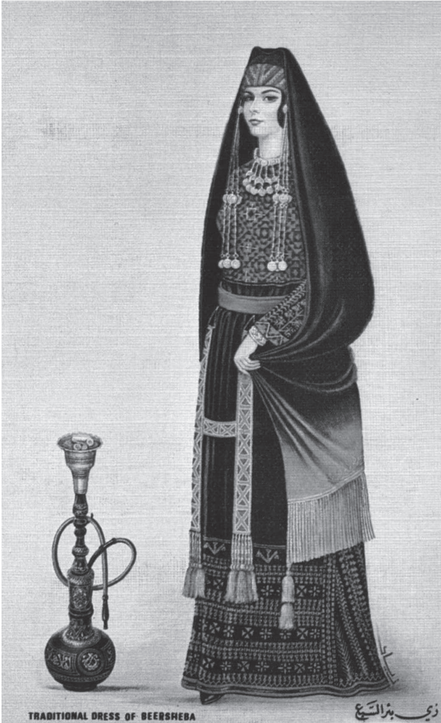
Le narguilé et les femmes en Palestine