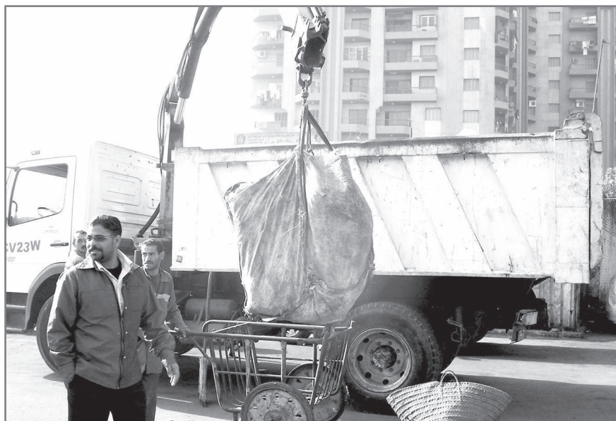
Figure 4– Équipement de l'entreprise AAEC adapté à la collecte des déchets ménagers dans les quartiers à la voirie étroite (vienne ville et quartiers informels). Auteur : Lise Debout, mars 2009.

n'ayant plus les moyens d'investir, ni même d'entretenir son matériel, le service qu'elle offre se dégrade et, en retour, la société se voit imposer des pénalités par la GCBA. Or, c'est la même agence qui est en partie responsable des retards de paiement de la société... En août 2009, IES cesse la collecte des déchets pour faire pression sur le gouvernorat... En pleine chaleur, les ordures s'accumulent dans les rues : l'entreprise s'est finalement vu accorder une aide financière par le ministère de l'Environnement. Cette nouvelle « crise » est amplement diffusée par les journaux et est l'occasion de faire ressurgir les débats nationalistes : « Ni espagnole, ni italienne, la solution est dans une entreprise égyptienne! » (Debout, 2007 et 2009). Les entreprises EES et IES n'ont pas négocié avec les zabbâlîn des petits quartiers qui, moins organisés et bien moins équipés en matériel que ceux de Manchiat Nasser, n'ont pas eu voix au chapitre. En conséquence, elles se trouvent dans une situation plus opaque et ne parviennent à rendre un service complet, notamment dans certains quartiers pauvres.