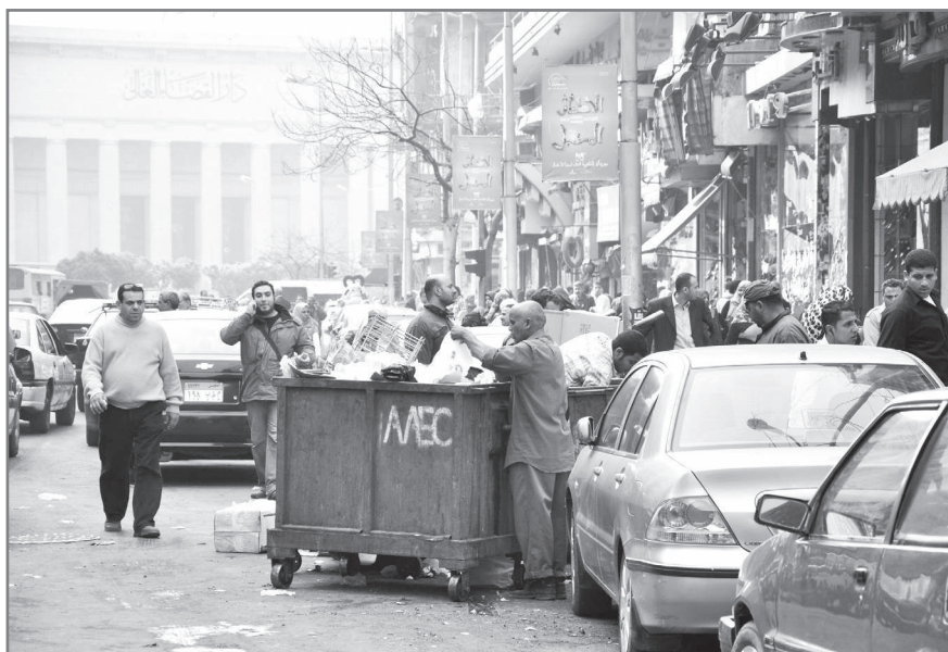
Figure 2– Une rue du centre-ville. Deux chiffonniers (l'un à l'extérieur de la benne, l'autre debout à l'intérieur en retrait du premier) cherchent des cartons ou des plastiques. La benne appartient à l'entreprise AAEC. Auteur : Pascal Garret, février 2010.

leurs territoires professionnels, les parcours varient en fonction du danger. Les façons de faire sont inégales et différencient ceux qui possèdent un pick-up , de ceux qui utilisent une charrette tirée par un âne ou de ceux qui sont à pied et qui sont dans une position encore plus vulnérable. De même, certains d'entre eux ont conclu des accords avec les commerçants ou avec les concierges d'immeubles qui gardent pour eux les déchets ; mais ces procédés ne concernent pas tous les zabbâln , loin s'en faut. A Manchiat Nasser, d'après l'un des responsables associatif, environ un quart des zabbâln – estimation difficile à vérifier – aurait totalement cessé le porte-à-porte et, sans territoire de collecte particulier, ramasserait dans la rue, dans les bennes et auprès des commerçants, exclusivement le carton et le plastique destinés au recyclage (entretien auprès du président de l'Association des collecteurs de déchets entretien, Manchiat Nasser, février 2010, BF).