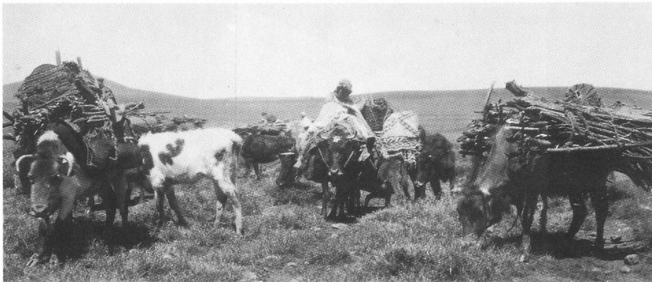
Bœuf porteur chez les Ayt Arfa du Guigou vers 1930. Photo E. Laoust

Bœufs porteurs chez les Ayt Arfa du Guigou vers 1930. Photo E. Laoust.