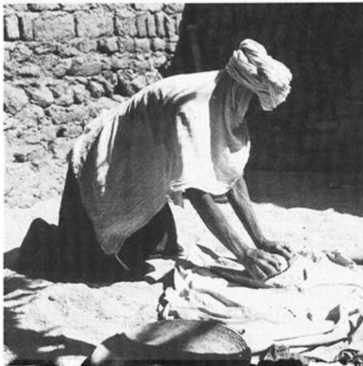
3. PLAT RÉEMPLOYÉ COMME MEULE, PERFORÉ PAR USURE EN SON MILIEU.