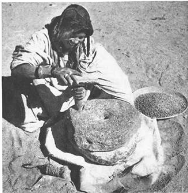
3. MEULAGE DU GRAIN EN POSITION AGENOUILLÉE.