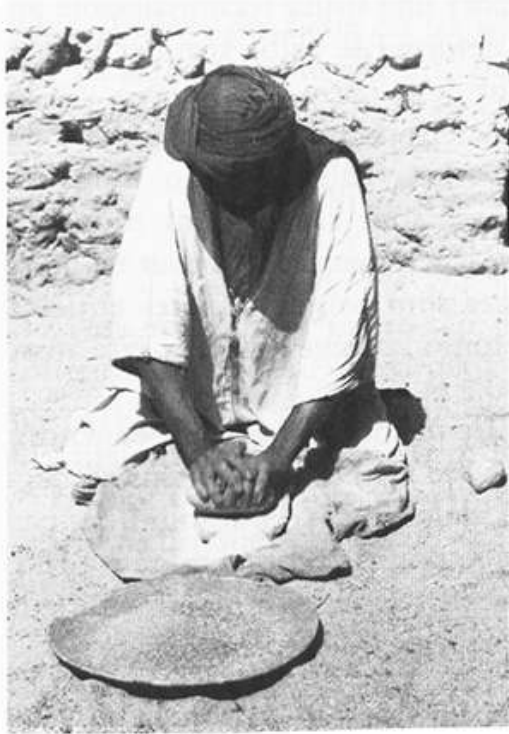
2. MEULAGE DU grain EN POSITION ASSISE.