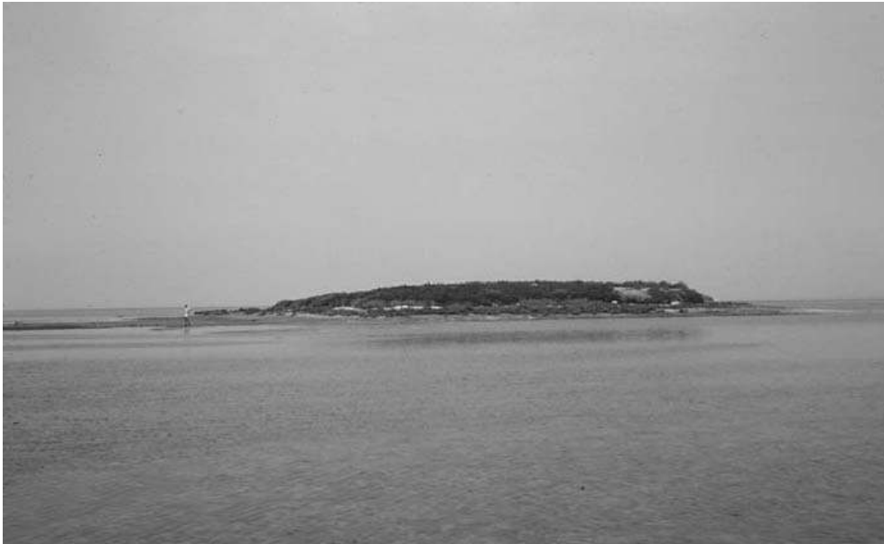
Fig. 2. L'îlot du Centre (Dzirat el Laboua).