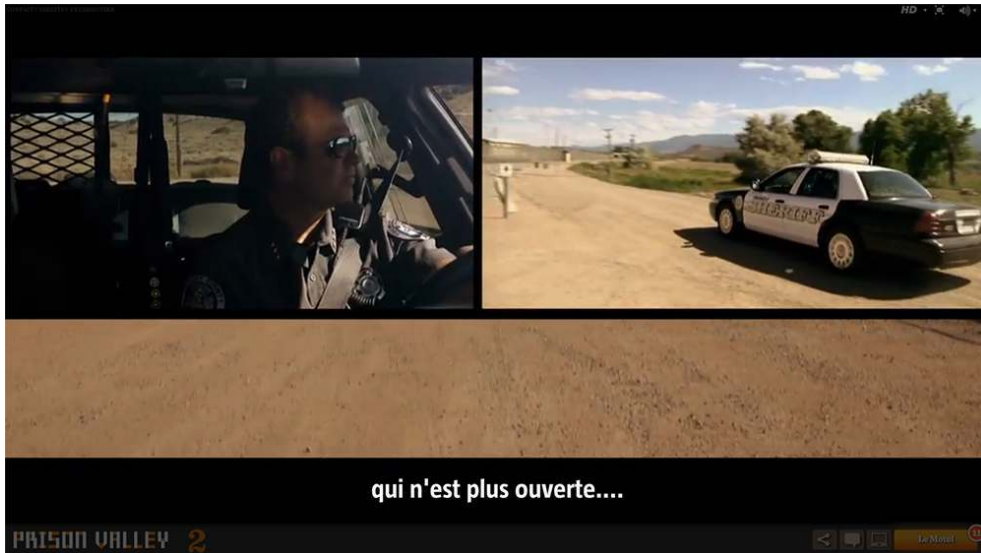
Figure 2 : multifenêtrage / « Prison Valley »

L'ensemble des solutions retenues est varié et inséré dans chaque partie du webdocumentaire. Complémentarité, télescopage, juxtaposition sont autant de possibilités pour s'adresser au public, pour l'interpeller, pour maintenir son attention en renouvelant aussi le contrôle du rythme de l'ensemble créé. Cependant nous remarquerons que si la gestion du fenêtrage est au service de la construction visuelle, elle s'inscrit peu dans le développement de l'interactivité.