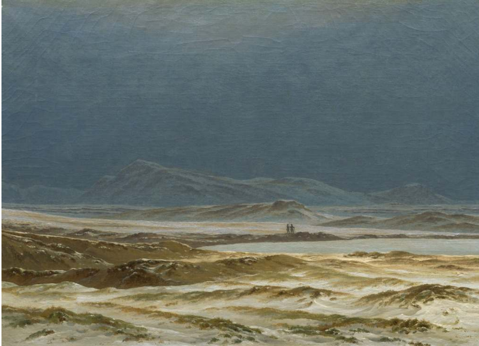
Fig. 7 : Caspar Friedrich, Northern Landscape, Spring (c. 1825)

désertique et à ressentir une mélancolie si bien évoquée par les romantiques, tels que Caspar Friedrich (fig.7).