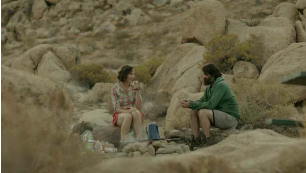
Fig. 8 : Photogramme extrait du pilote de la série The Last Man on Earth

pain, jusqu'à ce que tu retournes dans la terre, d'où tu as été pris ; car tu es poussière, et tu retourneras dans la poussière » ( Genèse , I.19). C'est d'ailleurs dans ce paysage que les protagonistes de la série The Last Man on Earth (2015-présent, Fox) se rencontrent lors du premier épisode. Le dernier homme sur Terre trouve la dernière femme (suite à la décimation du reste de la population par un virus) dans une sorte de Genèse inversée où la désolation remplace le paradis et le désert la nature luxuriante, comme pour signifier que notre monde contemporain serait perdu (fig. 8).