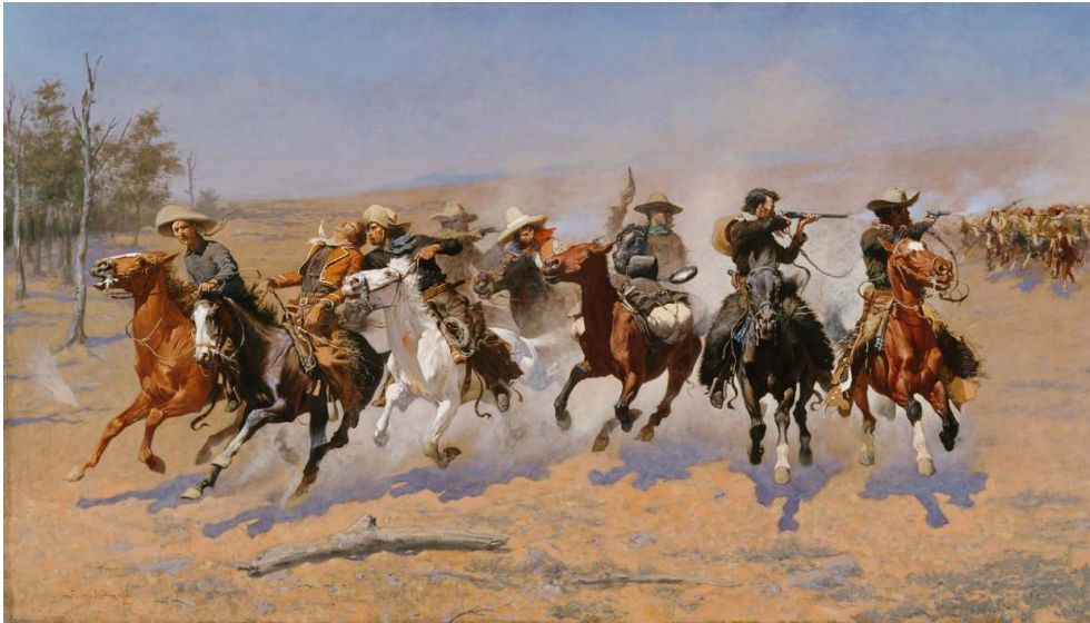
Fig. 1 : Frederic Remington, A Dash for the Timber (1889)

Cathedral Rock en Arizona, le studio Old Tucson en Arizona et la vallée de Tabernas en Espagne.