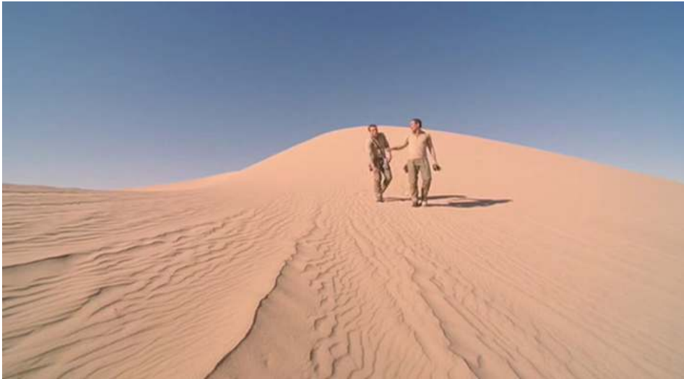
Fig. 6 : Photogramme extrait de l'épisode Desert Crossing (épisode 24 de la saison 1) de la série Star Trek : Enterprise