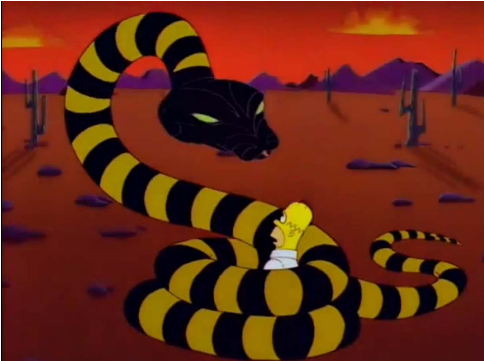
Fig. 9 : Photogramme extrait de l'épisode 9 de la saison 8 des Simpsons

érémétique. Propice à la monstration et à l'évocation du mouvement et du déplacement, que celui-ci soit physique ou mental, il devient, dans les séries, synonyme d'un espace de transition, où divers rituels initiatiques auront lieu. Dans le neuvième épisode de la huitième saison des Simpsons (1989-présent, Fox), Homer, après avoir ingurgité d'étranges piments, se trouve pris d'une hallucination visuelle dans laquelle plusieurs éléments de l'imaginaire biblique du désert sont représentés (fig. 9) : la chaleur et l'aridité (symbolisées par le soleil et la couleur rouge omniprésente, voire écrasante), le danger (par un serpent, notamment) et la quête initiatique (qui lui est proposée par un renard).