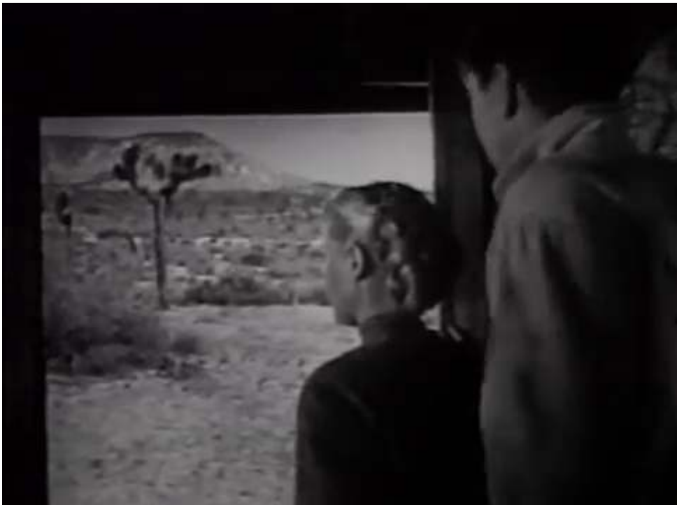
Fig. 2 : Photogramme extrait de l'épisode Sego Lilies (épisode 16 de la saison 1, 1953) de la série Les Aventuriers du Far West . On notera la similitude avec certains plans du film La Prisonnière du désert (1956) de John Ford.