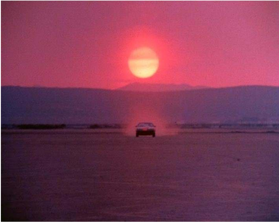
Fig. 3 : Photogramme extrait du générique de la série K-2000