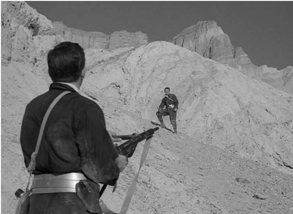
Fig. 4 : Photographie extraite de l'épisode 15 de la saison 1 de la série La Quatrième Dimension (1959-1964, CBS)

lignes de fuite et la répartition dans le champ des vides et des pleins organisent aussi bien la structure du paysage que la hiérarchisation des personnages (fig. 4).