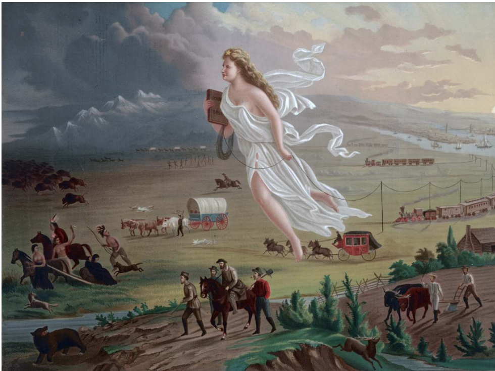
Fig. 10 : Allégorie de la « destinée manifeste » : John Gast, American Progress (c. 1872)

symbolise les sombres secrets et activités de la vie de Walter White. A plusieurs niveaux, la série traite d'ailleurs des frontières, telles des lignes dans le sable que les personnages dessinent pour eux-mêmes et pour les autres. Elle met également en lumière le franchissement de ces lignes, de ces limites. Au fur et à mesure que la série avance, les protagonistes s'adaptent et évoluent et la frontière marquant la séparation entre White et Heisenberg, entre sa vie à Albuquerque et celle du désert, s'amointrit. Le désert se transforme alors dans Breaking Bad en un lieu où l'on s'affronte soi-même, où l'on apprend à découvrir son double, cet autre soi-même ; l'étranger n'est plus autrui. Cette série fait alors se rencontrer par le biais d'un pivot subtil les deux imaginaires du désert que nous avons décrits ici : l'imaginaire historique, amplifié par les arts et notamment le cinéma – plus spécifiquement les westerns – et l'imaginaire mystique, qui n'en est pas si éloigné. Défendue par les républicains-démocrates au cours du XIXe siècle, l'idéologie qui soutient la « destinée manifeste » du peuple américain durant la Conquête de l'Ouest est, en effet, fondée sur la conviction que la nation américaine a été guidée par une force divine (fig. 10).