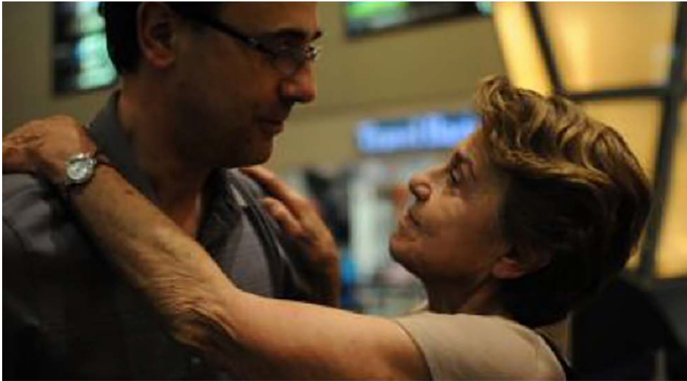
La mère et l'un des frères de la cinéaste - Grandir (2013)