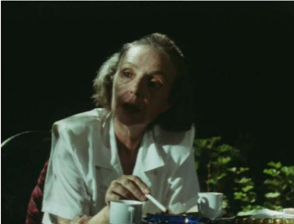
Fanny Colonna - Rester là-bas (1991)