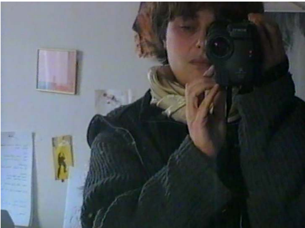
Autoportrait au miroir - Demain et encore demain (1995)