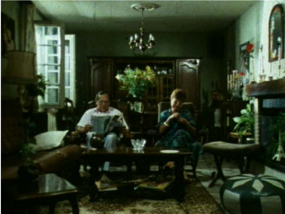
L'intérieur du pavillon familial - Ici là-bas (1988)

train de découvrir, le cinéma, et avec ma famille, mes parents, ma sœur, mon frère. Je cherchais à faire les choses pour qu'elles soient le plus juste possibles pour moi, très modestement, sans performance. J'en étais là et je voulais faire un film à partir de ce que j'étais et de ce que je pouvais faire. Et ce que je pouvais, c'était essayer de rendre exactement la parole de ma mère, filmer non pas quelques images de mes parents mais des instants véritables, filmer aussi quelque chose qui a été très peu filmé, un intérieur de la classe moyenne de cette époque : le salon, les objets, l'univers domestique d'un pavillon populaire. Je n'ai pas mené des interviews au sens classique du terme mais par mon écoute et par ma concentration, j'ai essayé de restituer la présence des personnes filmées, notre lien. On est loin de la maîtrise et de l'artefact.