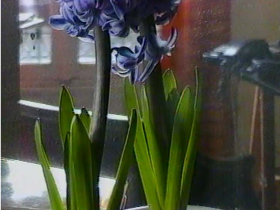
Le rêve de la jacinthe - Demain et encore demain (1995)