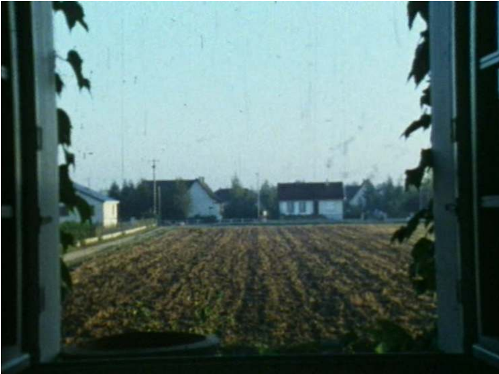
Vue sur le Val de Loire - Ici là-bas (1988)