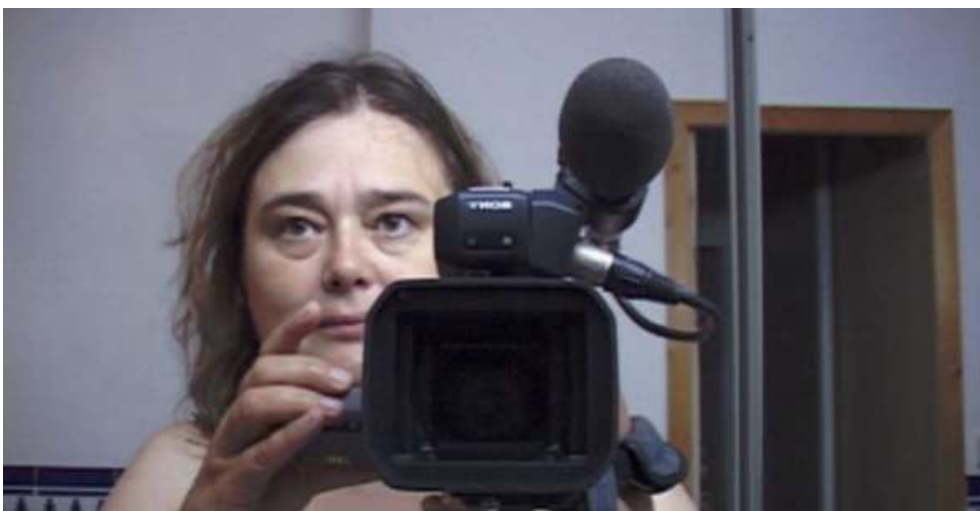
Autoportrait au miroir - Grandir (2013)