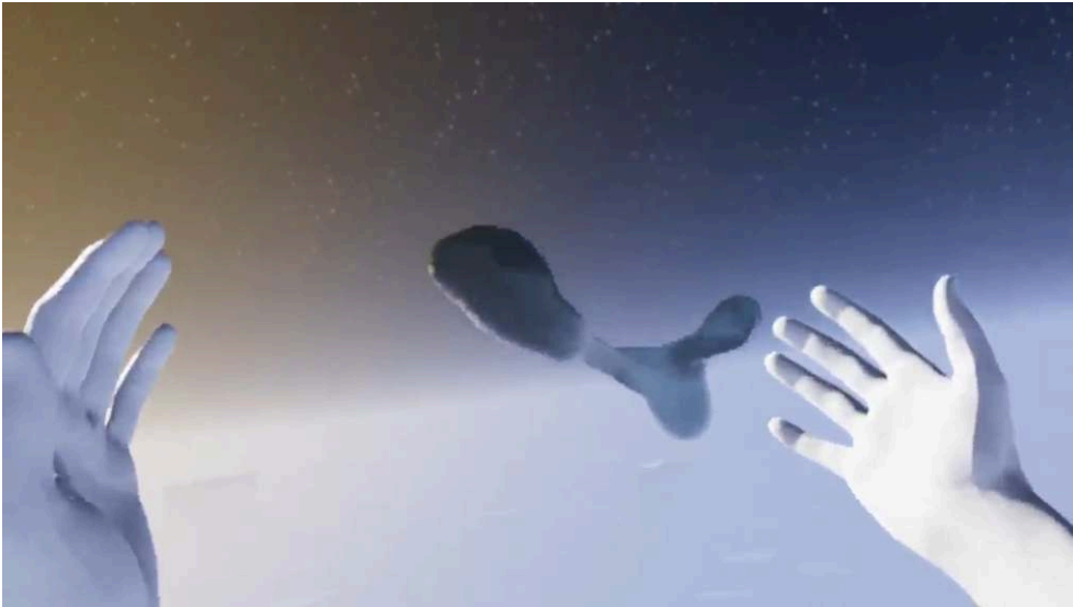
Figure 3 : Rendu initial des mains et du fluide. 2017