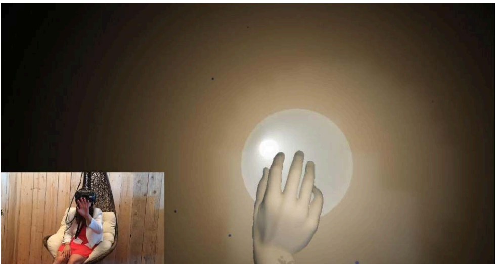
Figure 6 : Ouverture du tunnel lumineux