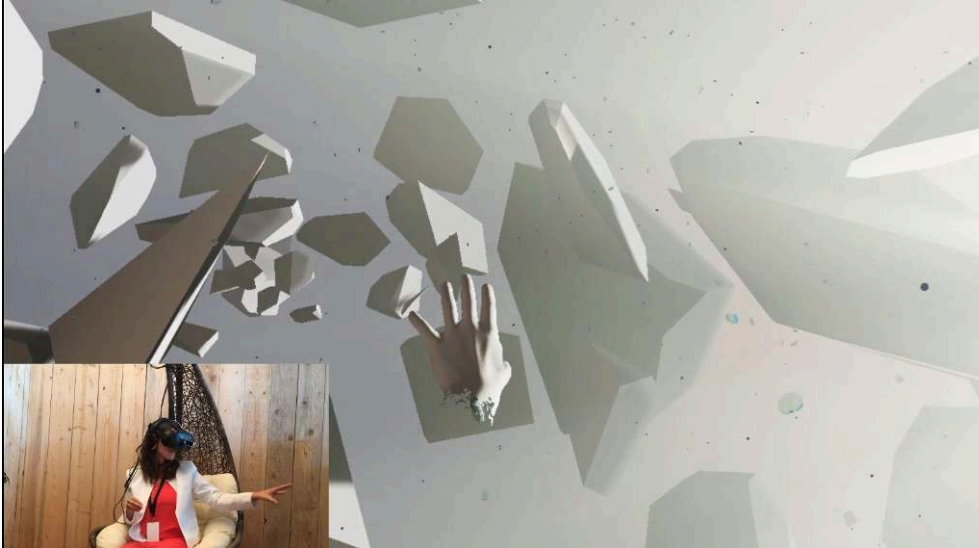
Figure 5 : Simulations de fracture d'objets solides sur les parois de murs