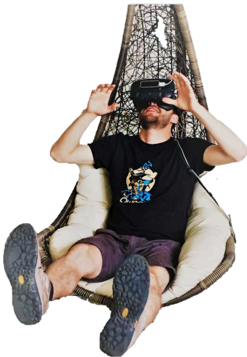
Figure 8 : Utilisation de la balancelle comme support physique.