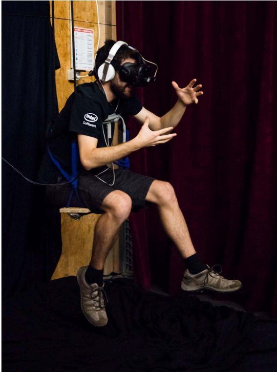
Figure 1 : Dispositif initial. 2017

pieds encouragerait l'idée de pouvoir agir et flotter, et pourtant le corps restait invisible, non représenté. Enfin, nous avons identifié un besoin de délimiter des espaces, similairement au renversement du corps des circassiennes, par des passages qui s'apparentent à une cassure, à un acte pénétrant.