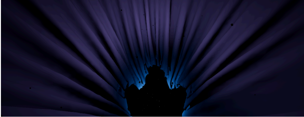
Figure 4 : Simulations de drapés 2018

de la physique. Elle nous a permis de simuler un rideau (voir Figure 4). Respectant une gravité terrienne, ce tissu faisait le lien avec la réalité au début et à la fin de l'expérience. En plaçant comme première interaction des tissus, nous faisons appel à quelque chose de connu chez le spectateur. De par sa proximité, cet élément appelle naturellement au contact et induit inconsciemment au toucher. En référence au lever de rideau au théâtre, il était du ressort du spectateur de démarrer l'expérience en écartant ce rideau de ses propres mains.