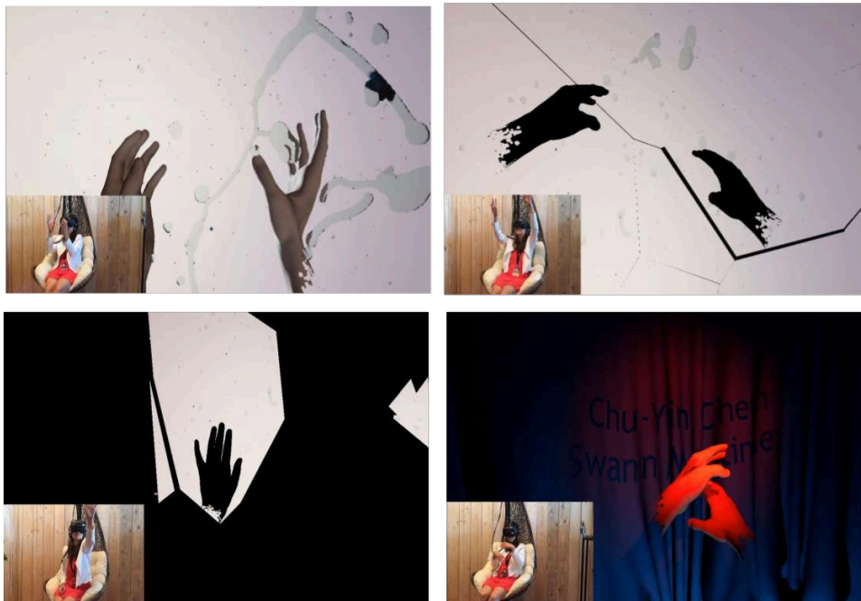
Figure 7 : Évolution de l'environnement au cours du temps