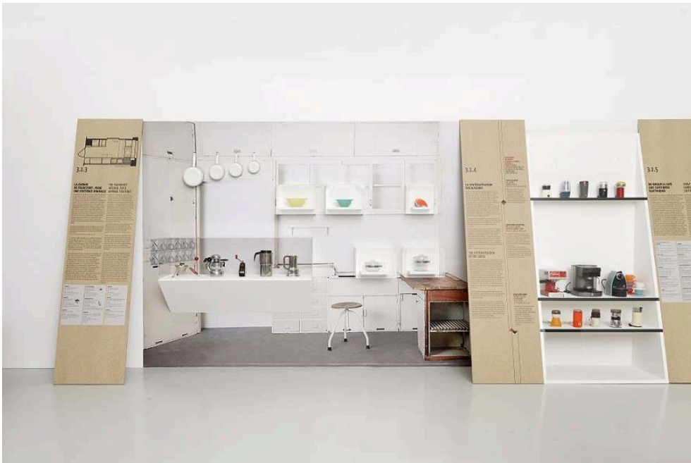
Fig.4. Vue de l'exposition Déjà vu, l'ère des machines domestiques

Une présentation tout en simplicité et élégance pour mettre en avant ce temps fort des objets en cuisine. Moulin, robots, mixeurs, etc., colonisent alors nos cuisines repensées pour un usage rationnel. Une impression de « déjà vu » ... En effet beaucoup de ces objets sont passés de la cuisine au placard... mais sont également dans notre mémoire.