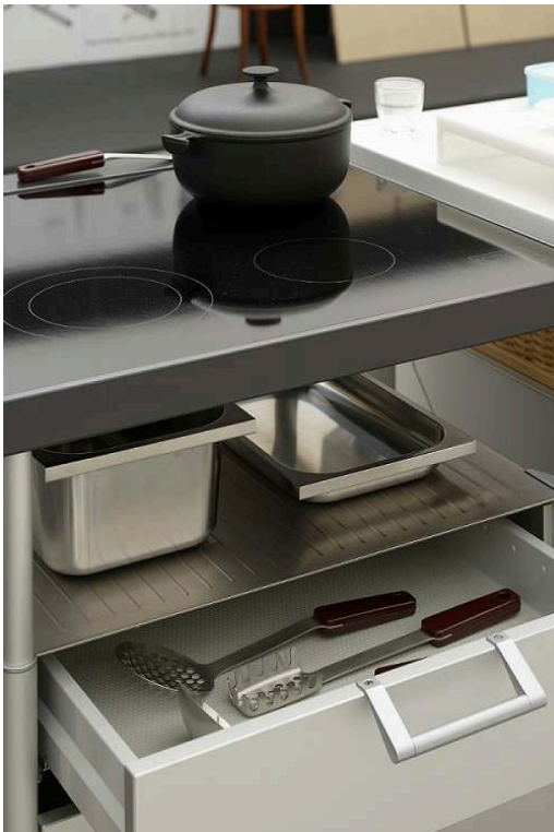
Fig.3. Objets déjà vus, objets revus par les designers

Cette scénographie met en valeur des objets familiers revisités par des designers. ENZO MARI , Cocotte 23 , 1970, fonte, éditeur et fabricant Le Creuset, Fresnoy-le-Grand (France), collection MAMC+.