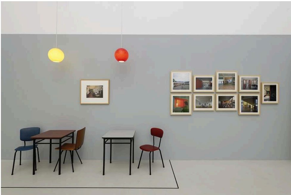
Fig.1. Vue de l'exposition Déjà vu , tables et chaises du foyer Clairvivre et photographies d'Ito Josué

Un des moments forts de l'exposition où Imke Plinta met en avant le mobilier Wogenscky créé pour le foyer Clairvivre de Saint-Étienne et les tranches de vie photographiées du quartier Firminy-Vert par Ito Josué. ANDRÉ WOGENSCKY , Tables et chaises du foyer Clairvivre (Saint-Étienne) , 1964, métal, mélaminé, collection MAMC+. À gauche : ITO JOSUÉ , Firminy : place du centre, foyer de personnes âgées , 1960, tirage d'après négatif, collection MAMC+. À droite : ITO JOSUÉ , Ensemble de photographies de Firminy-Vert , fin 1969-début 1970, tirages d'après négatif, collection MAMC+