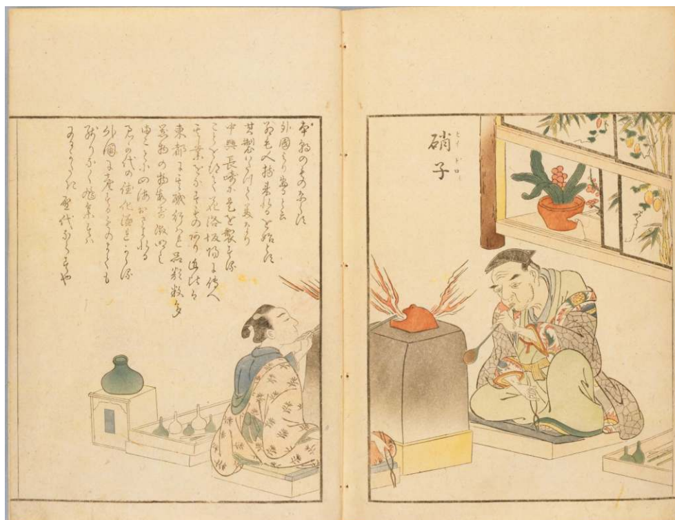
Gravure en couleur illustrant la Classification des artisans ( Saiga shikunin burui ) par TACHIBANA Minkō, 1770