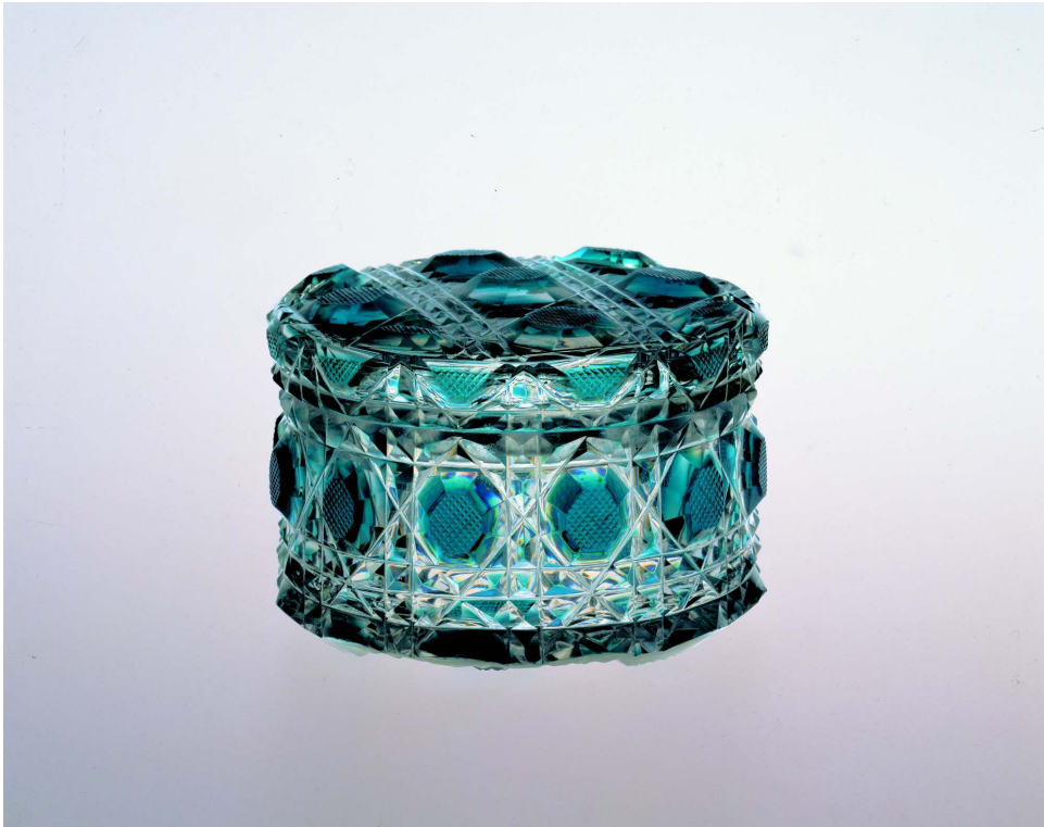
Verre plaqué turquoise sur translucide, taillé avec des motifs en « diamant », 1851-1858. Dimensions : 6,8 cm de haut par 9,8 cm de diamètre.