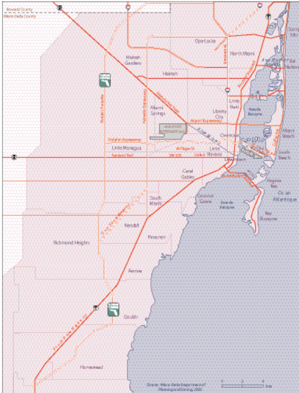
Carte 1 - L'aire métropolitaine de Miami