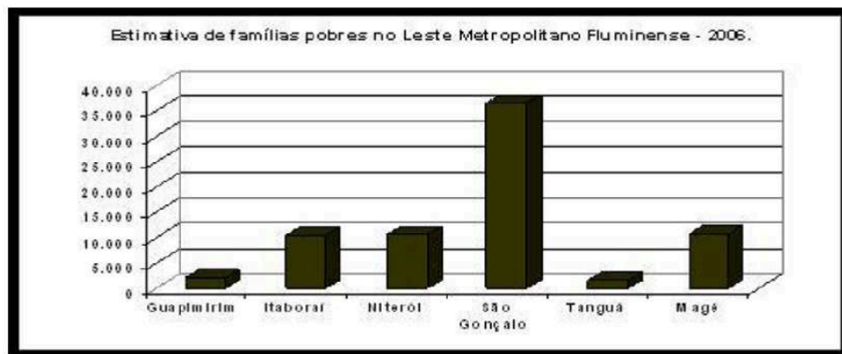
Tabela 1: Estimativa de famílias pobres no Leste Metropolitano Fluminense (2006)

FONTE: MINISTÉRIO DO DESENVOLVIMENTO SOCIAL