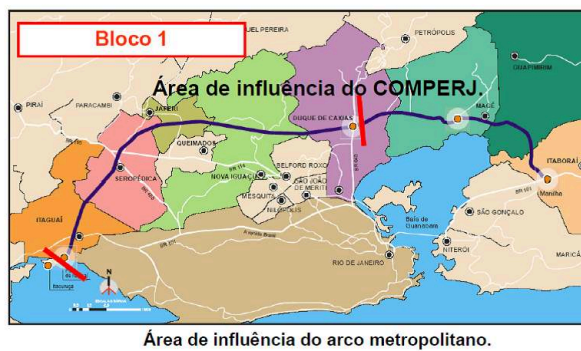
Área de influência do arco metropolitano.