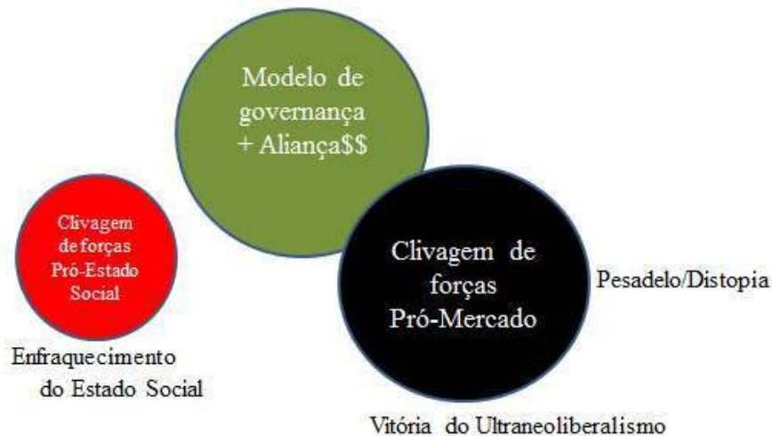
Figura - 3. O pesadelo da globalização subordinada Brasil: Período atual - Golpe de Estado Globalização subordinada - 2016/2017