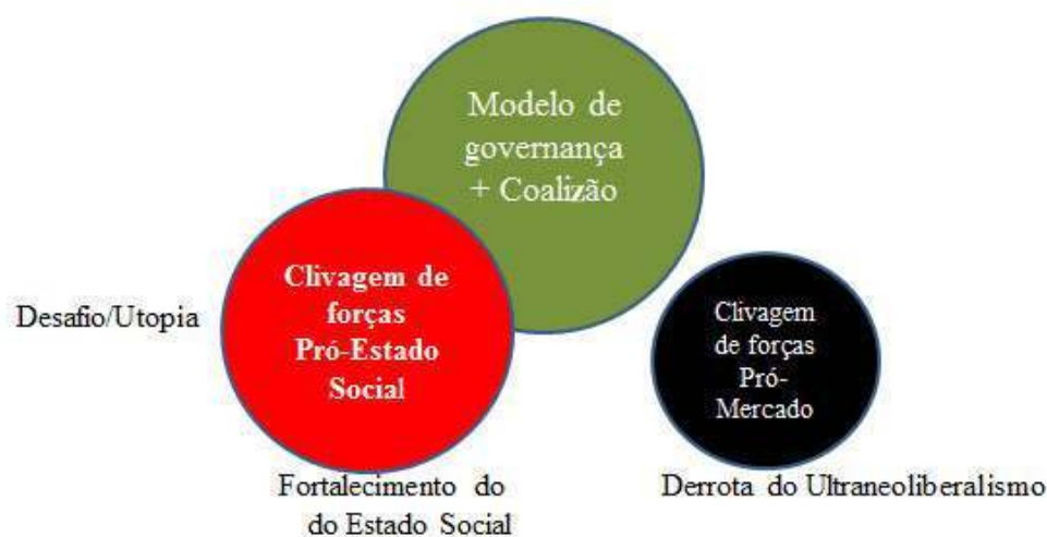
Figura - 2. Desafios da globalização não subordinada Brasil: 13 Anos de Globalização não subordinada - 2003/2016