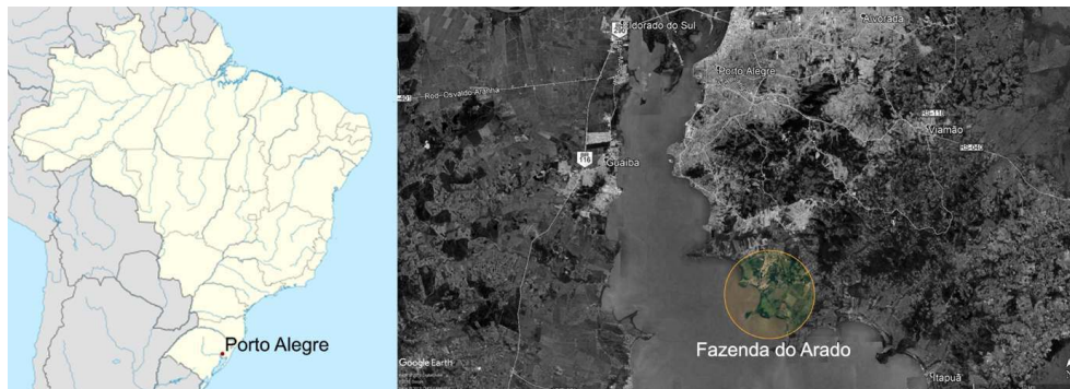
Figura 1- Localização geral. Porto Alegre no Brasil e a Fazenda do Arado em Porto Alegre.