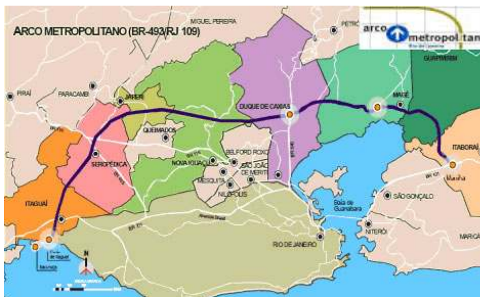
Imagem 1: Arco Metropolitano do Rio de Janeiro