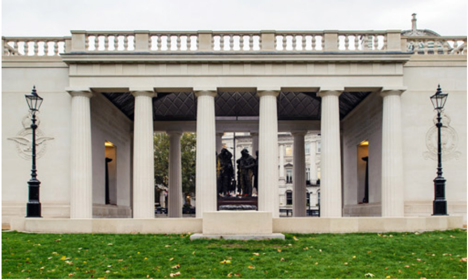
© Bomber Command , Memorial Association, 2012. Vue extérieure du mémorial du Bomber Command depuis Green Park.

Ce mémorial est dédié aux 55 573 aviateurs du Royaume-Uni, du Commonwealth et des nations alliées qui ont servi dans le RAF Bomber Command et ont perdu la vie pendant la Seconde Guerre mondiale 32 .