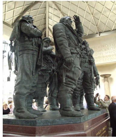
© Madeline Zielinski, 2012. Les membres d'équipage, sculptés par Philip Jackson.

Le mémorial du Bomber Command à Green Park est imposant ; sa taille, à elle seule, fait de l'ombre à tous les autres mémoriaux de la Seconde Guerre mondiale de la capitale. Nous pouvons donc nous interroger sur l'importance que l'on a voulu donner à ce monument, de même que sur le message dont celui-ci est porteur. Le critique d'art victorien John Ruskin avait avancé dans ses écrits au XIX e siècle la théorie selon laquelle il existe un lien étroit entre l'esthétique de l'architecture d'une société et les valeurs morales de celle-ci 34 . Ainsi l'architecture peut-elle se faire la voix des changements d'une société et des messages que celle-ci veut transmettre. Il semble que le mémorial du Bomber Command soit plus qu'un simple hommage au sacrifice de ses aviateurs : il grave dans la pierre le nouveau statut des équipages, désormais élevés au rang de héros. Après avoir été si longtemps écartés du récit héroïque de la