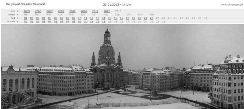
Figure 6. Capture d'écran du site Bauprojekt Dresden Neumarkt