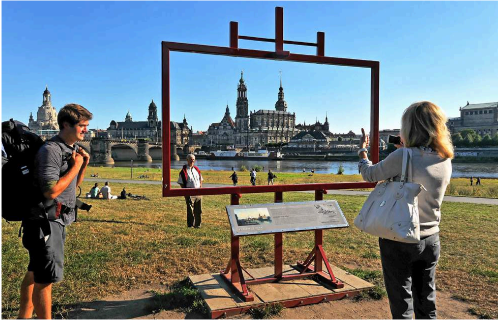
Figure 1. Rive de l'Elbe, Dresde, 2012