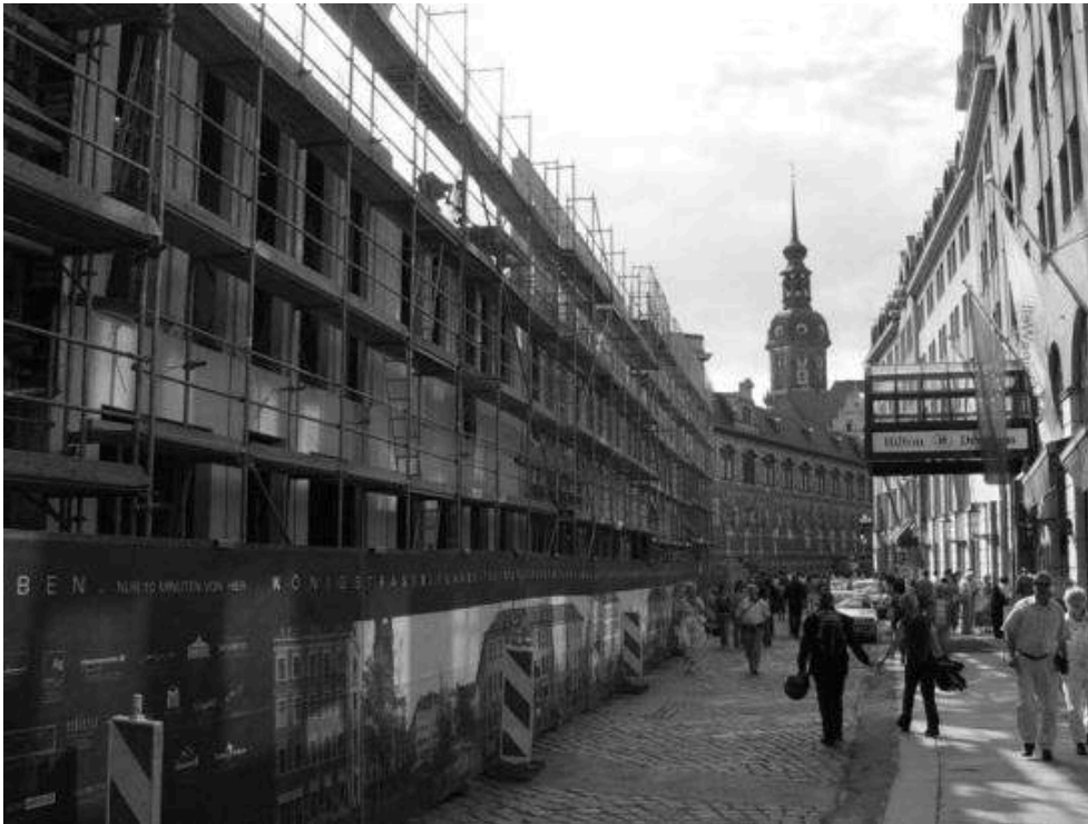
Figure 5. Kapflamm, Reconstruction of Dresden's Neumarkt , décembre 2003