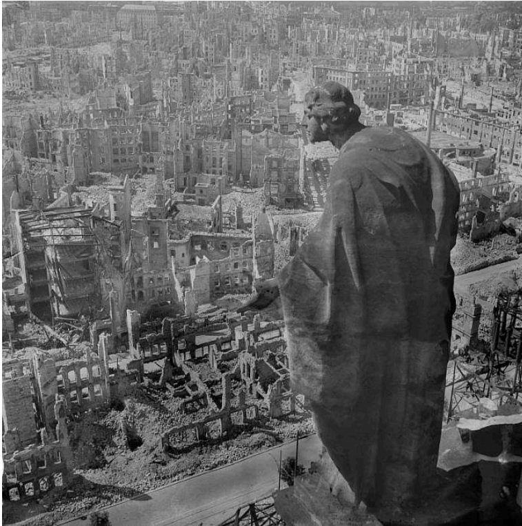
Figure 3. Richard Peters, Blick vom Rathausturm , 1945