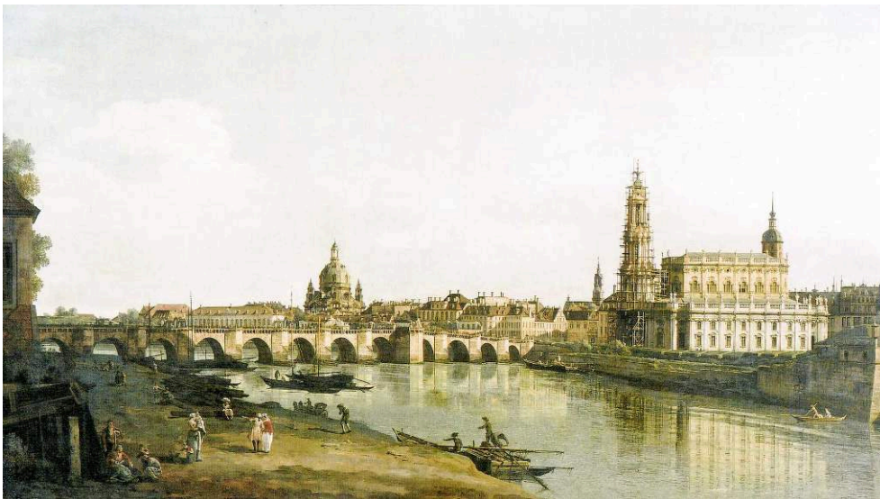
Figure 2. Bernardo Bellotto, Vue de Dresde depuis la rive droite de l'Elbe avec le pont Auguste , 1750

dépasser le cadre de l'histoire de la peinture et aller vers l'histoire du mythe lui-même. Pour reprendre les termes de Barthes, il s'agit d'analyser la manière dont les usages sociaux de la représentation lui ont attribuées des significations au fil des siècles 7 . Cette histoire médiatique de la représentation permet de comprendre comment la Stadtsilhouette devient la clé de voûte de l'imaginaire urbain de la ville de Saxe. Son rôle central persiste quand la nature du mythe évolue. En effet, si les vues de Bellotto soutiennent dans un premier temps une volonté politique de valorisation, elles participent après 1945 d'un discours de commémoration de la splendeur perdue, acquérant une dimension mémorielle, puis patrimoniale dans le cadre de la reconstruction du début du XXI e siècle.