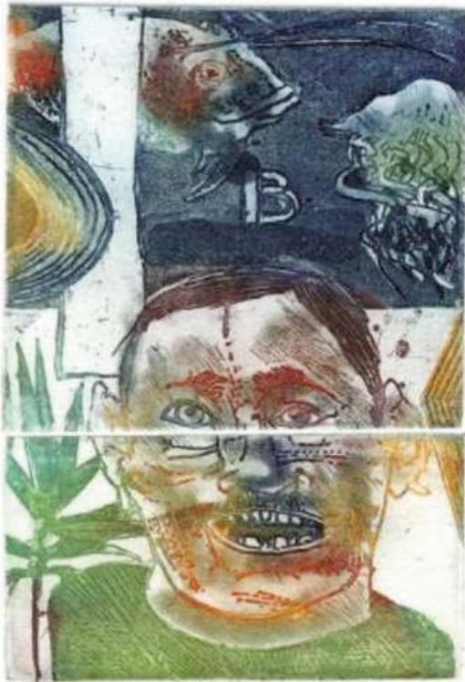
Roger Dewint. Méduse . Aquatinte, 2009