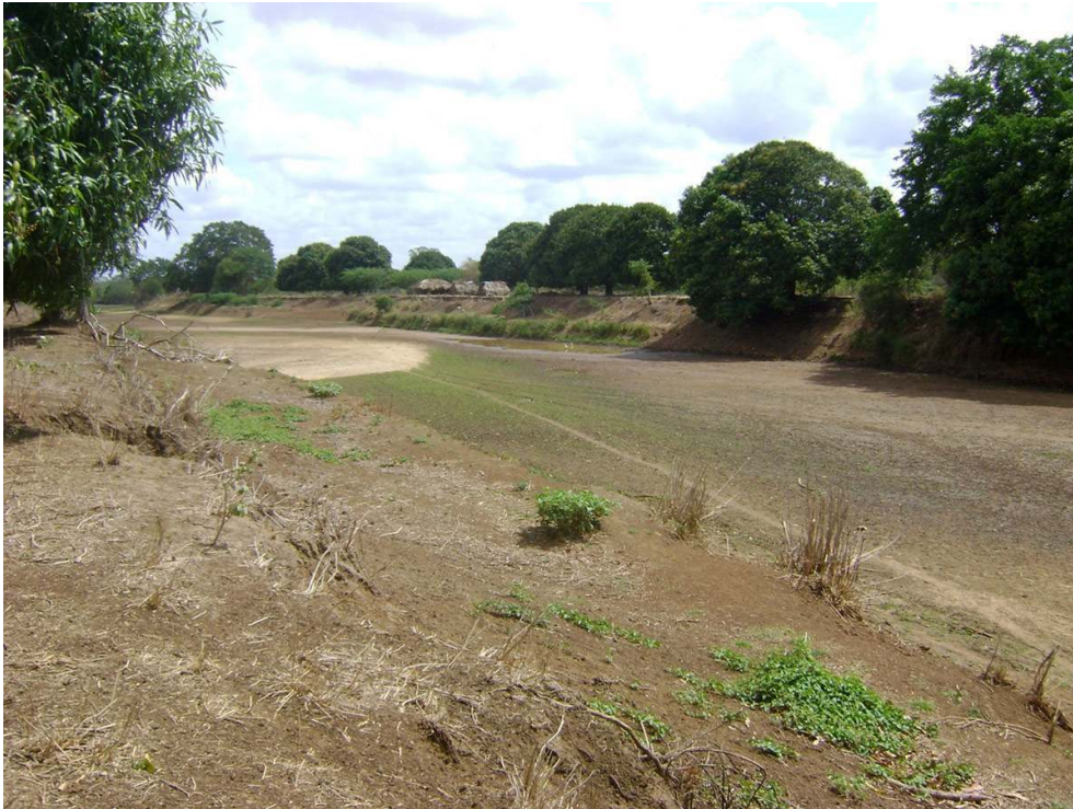
Figure 4 : Assèchement de la branche Oda (Février 2010)