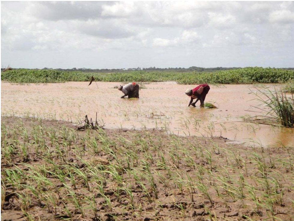
Figure 2 : Riz de survie planté par des femmes Pokomo dans la plaine centrale (Juillet 2012)

des enfants, assassinés. On dénombre une cinquantaine de victimes et de nombreux blessés. En septembre et octobre, des attaques similaires sont conduites par les deux communautés portant le total à plus de 200 victimes. À partir du mois de septembre 2012, les forces de police et en particulier le redouté General Service Unit (GSU, branche paramilitaire de la police nationale) sont déployés dans le delta pour mettre fin aux affrontements, et ce en employant des méthodes violentes (villages brûlés, passages à tabac). Une commission d'enquête est nommée et dirigée par Lady Justice Grace Nzyoka.