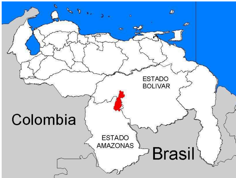
Figure 2 : Localisation