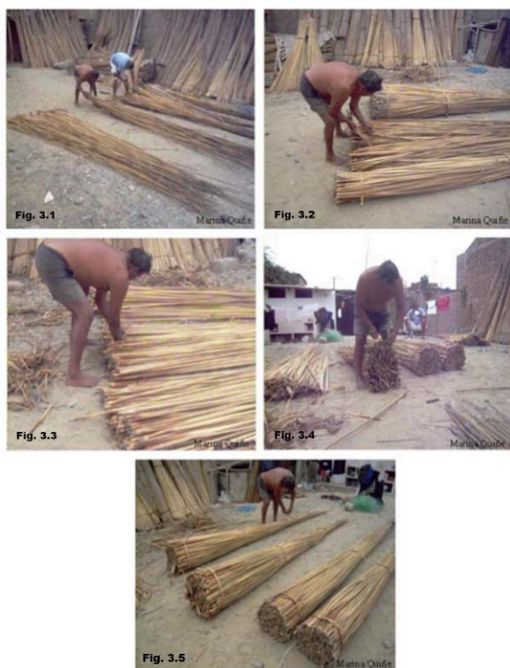
Figure 3 : Préparation de la titora