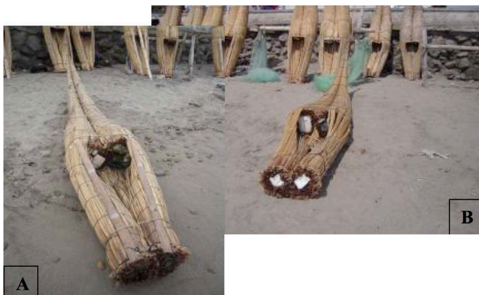
Figure 2 : Variations dans la construction d'un caballito . A : Caballito avec du plastique dans « Les fils ». B : Nouvelle modification du caballito avec du plastique dans « les fils » et « les mères »