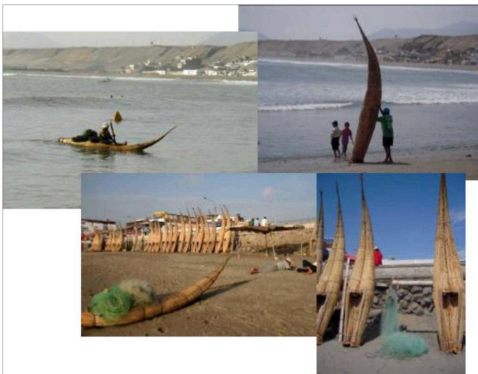
Figure 6 : La pêche en caballito