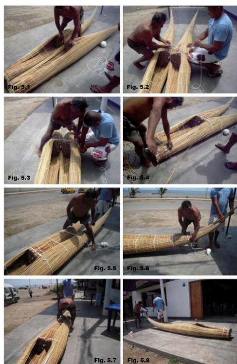
Figure 5 : Assemblage d'un caballito