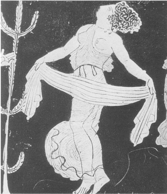
Fig. 4 : Ménade dansant tirée d'une peinture vasculaire apulienne du V e siècle avant J.-C. (Karlsruhe, Badisches Landesmuseum).