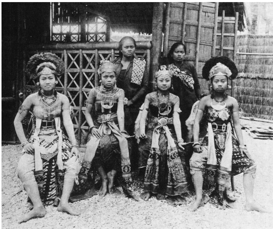
Fig. 1 : Les danseuses javanaises vues par Debussy lors de l'Exposition universelle de 1889

musiques entendues, les musiques évoquées, voire même rêvées, l'attention à ce qui provient d'une sensibilité nouvelle, tout cela permet au compositeur de rejeter l'influence wagnérienne subie dans sa jeunesse, et d'infléchir une certaine logique de l'évolution.