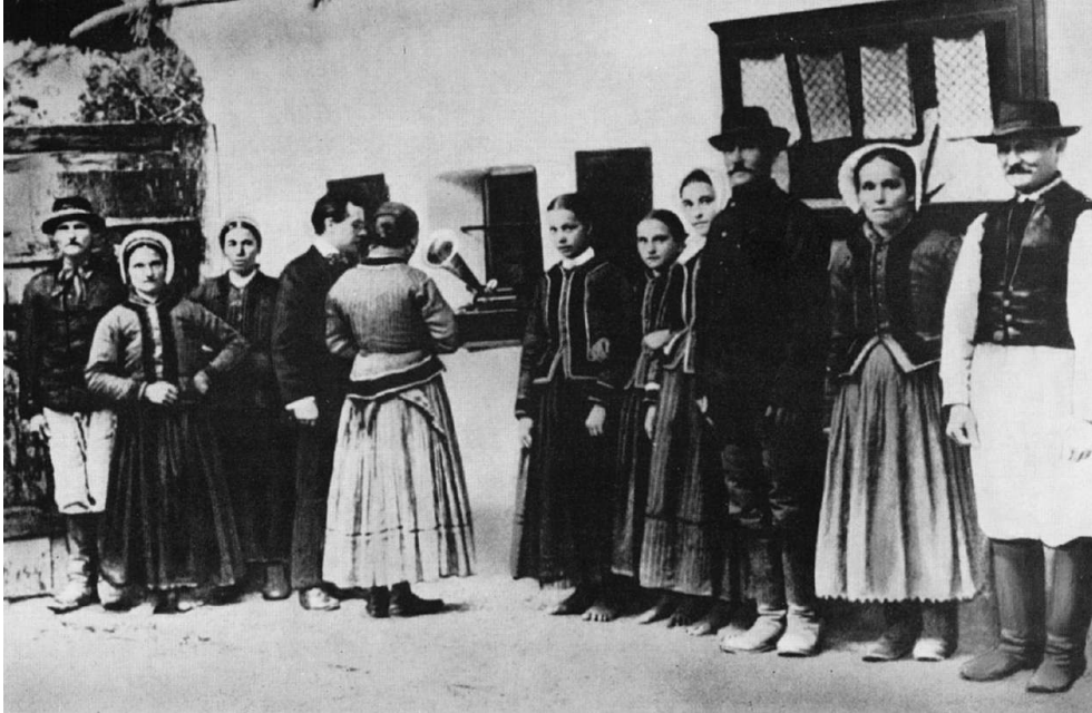
Fig. 2 : Bartók chez les paysans, 1908

partir de 1905. Le compositeur polonais Karol Szymanowski suivra une trajectoire semblable quelques années plus tard ; lui aussi composa dans un style post-romantique inspiré de Wagner et Strauss, avant de changer son écriture de manière radicale sous l'influence de la musique orientale à partir des années 1910-1914. Pour l'un comme pour l'autre, la rencontre avec la musique de Debussy fut déterminante et essentielle. Bartók influença à son tour non seulement les générations de compositeurs hongrois qui vinrent après lui (Veress, Ligeti, Kurtág), mais toute une série de compositeurs après la Deuxième Guerre mondiale, comme Maderna, Donatoni ou Holliger par exemple.