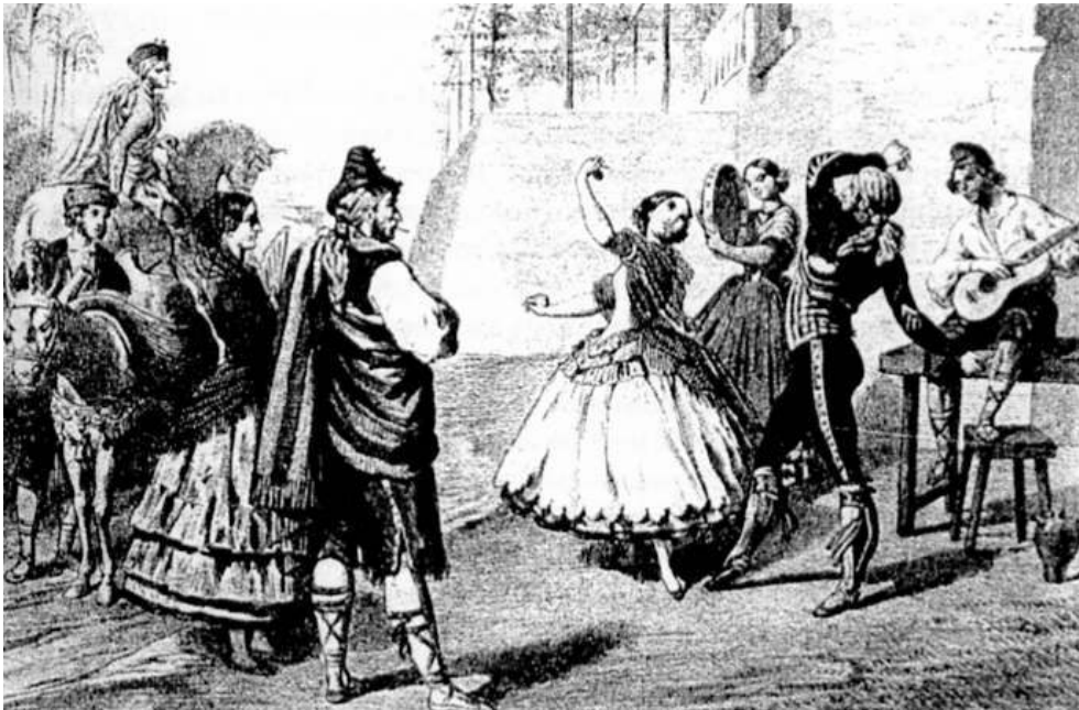
Fig. 1 : Lithogravure de Bocquin d'après un dessin de Leloir, XIX e siècle.