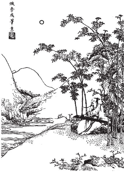
Fig. 1: Zhu li guan , illustration gravée sur bois dans le style de Li Cheng tirée de Huang Fengchi, «Recueil d'illustrations de poèmes des Tang» ( Tang shi huapu ), Xi'an, vers 1600, rééd. Shanghai guji chubanshe, 1982, p. 71.