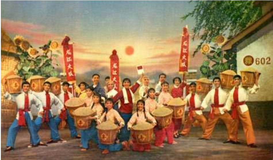
Fig. 1. Opéra de Pékin contemporain Longjiang song (Throne du Fleuve du Dragon) 现代京剧《龙江颂》