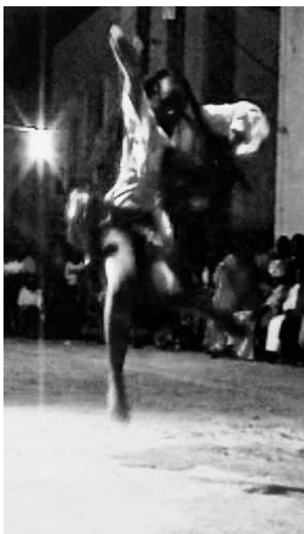
Fig. 8 : Kinesphère de la danseuse