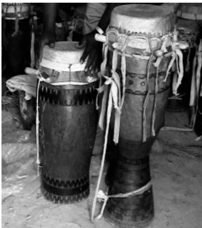
Fig. 3 (à droite) : Tambours mbëng mbëng , gorong mbabas et lamb