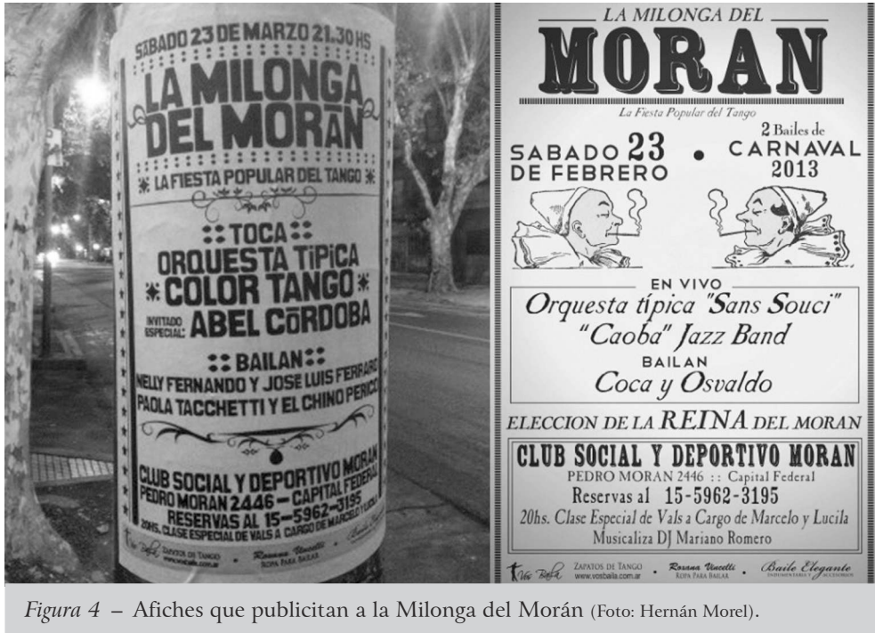
Figura 4 – Afiches que publicitan a la Milonga del Morán (Foto: Hernán Morel).

Podríamos decir que en estas milongas la organización del espacio interno es muy similar al de otras milongas de la zona, ello si tenemos en cuenta aspectos como el de la infraestructura, la iluminación, la ambientación, la distribución de las mesas o el espacio de la pista de baile. Sin embargo, en lo que refiere a las características de las personas que concurren, existen algunas diferencias significativas con las milongas de Villa Urquiza. En efecto, una crónica describe a la milonga del Morán del siguiente modo: