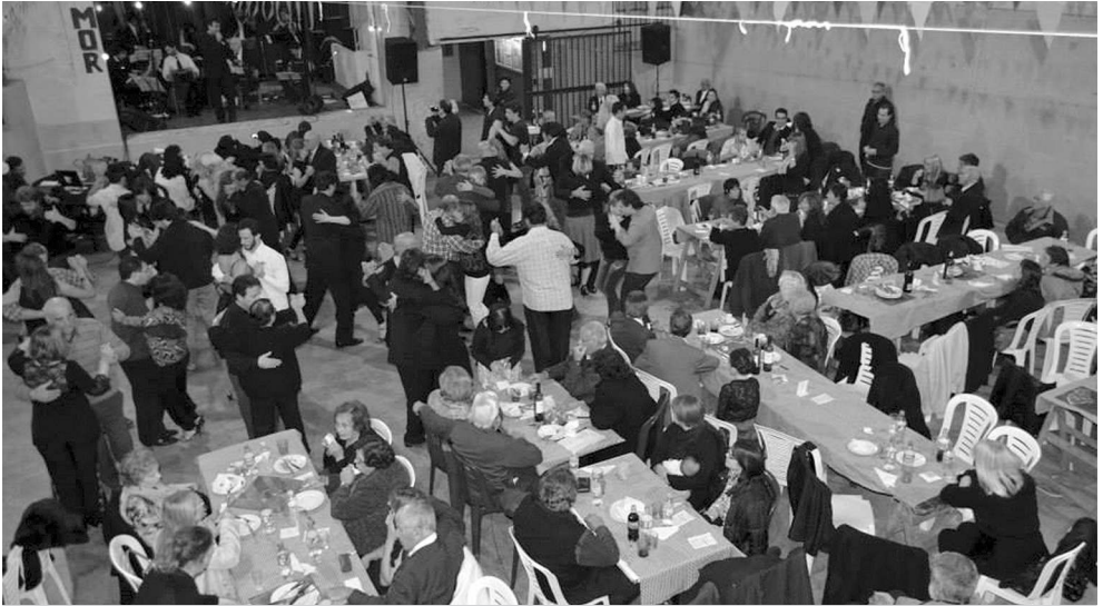
Figura 3 – La milonga del Morán.