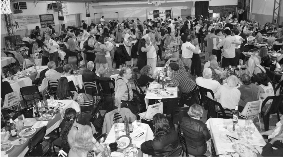
Figura 2 – La milonga del Sunderland Club.

para observar lo que ocurre dentro de la pista. Además, en estas mesas suelen estar los milongueros/as considerados/as con mayor reputación o aquellos/as que son bailarines/as profesionales. En consecuencia, las mesas que están más alejadas de la pista son utilizadas por las personas y grupos que no asisten tan frecuentemente a la milonga.