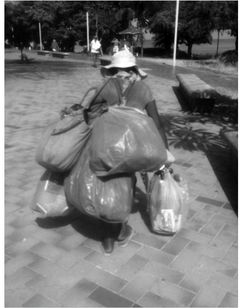
Figura 3 – O corpo e os pertences.

O sentido de singularidade inspirou-se na psicanálise quando retoma a história de cada um atravessando uma estrutura de disposições, mistura de afetos e sentimentos que, de várias formas, escapam às classificações ou nomeações com as quais tanto a ciência quanto as instituições procuram lidar. Por outro lado, a antropologia, na busca de observar para além das recorrências, encontra nas singularidades as marcas inscritas pela vida social que se escondem nos bastidores das cenas menos evidentes. Nosso intuito nesse escrito foi o de tentar avivar essas várias marcas, entendendo que, nesse borrar de fronteiras disciplinares, certas linhas de