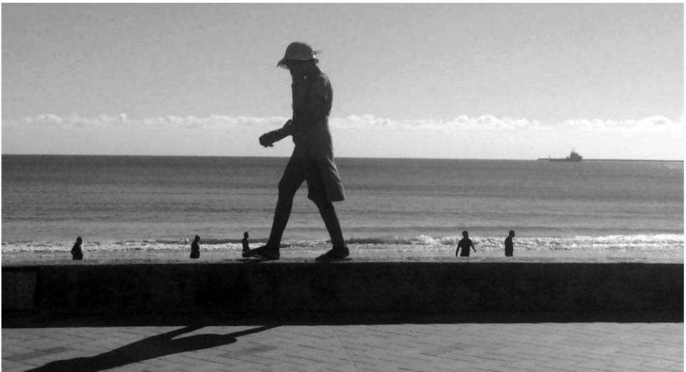
Figura 2 – Os passos de dona Maria. Fotografia: Glória Diógenes, agosto de 2016.

Essa condição de recriação das rotinas de casa e trabalho foi também tratada por José de Souza Martins (2015), incluindo exemplos de moradores de