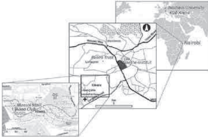
ILLUSTRATION 4. — LE TRIPLE JEU D'ÉCHELLE DE LA RENCONTRE ENTRE OCHUO ET L'ART CONTEMPORAIN

Elle justifiait cette demande par le fait que cet article pouvait servir aux médiateurs du KUB Arena dans la préparation des visites guidées 31 . Cela démontre bien la valeur ajoutée de la controverse nairoienne aux yeux de cette institution.