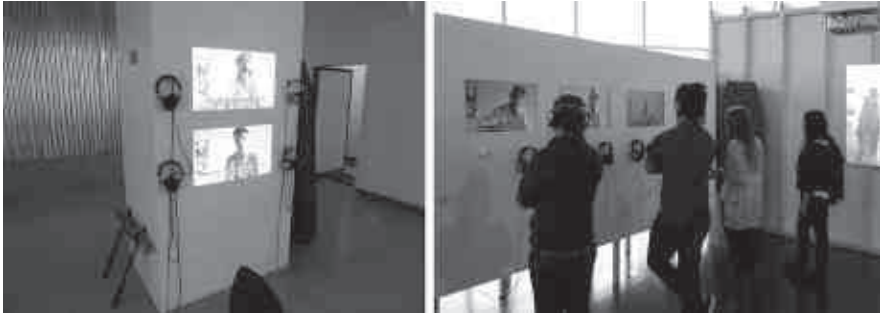
ILLUSTRATION 1. — INSTALLATION PRÉSENTÉE AU GOETHE-INSTITUT DE NAIROBI, EN 2011 (G) PUIS AU KUB ARENA DE BREGENZ, EN 2013 (D)