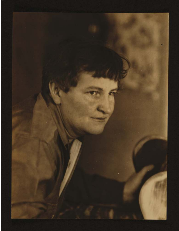
Fig. 1. B. Abbott, « Elizabeth McCausland, Jan 1935 », tirage gélatino-argentique, 12 x 9 cm, coll. Elizabeth McCausland papers, Archives of American Art, Smithsonian Institution.

et l'esthétique de la photographie étaient alors confinés à un nombre restreint de spécialistes qui s'influençaient, s'opposaient et se répondaient par le biais d'expositions, d'articles et d'ouvrages. Parmi les acteurs du milieu photographique de cette période, l'historienne de l'art Elizabeth McCausland (1899-1965) 6 était la principale porte-parole d'une approche sociale et anti-moderniste de la photographie documentaire.