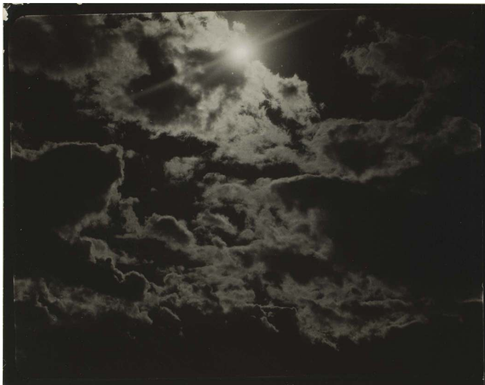
Fig. 7. A. Stieglitz, « Equivalent », tirage gélatino-argentique, 9,3 x 11,6 cm, 1923, coll. George Eastman House.