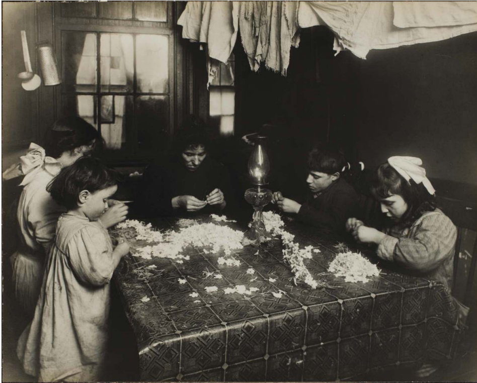
Fig. 5. L. W. Hine, « Italian Family making artificial flowers in East Side tenement, N.Y. », tirage gélatino-argentique, 18,3 x 23 cm, 1908, coll. George Eastman House, reproduit dans l'article de B. Newhall « Documentary Approach to Photography » (1938).

consciemment les éléments sociaux et esthétiques. Avec Hine l'objectif social était primordial ; les qualités esthétiques semblent être apparues presque par hasard 25 .