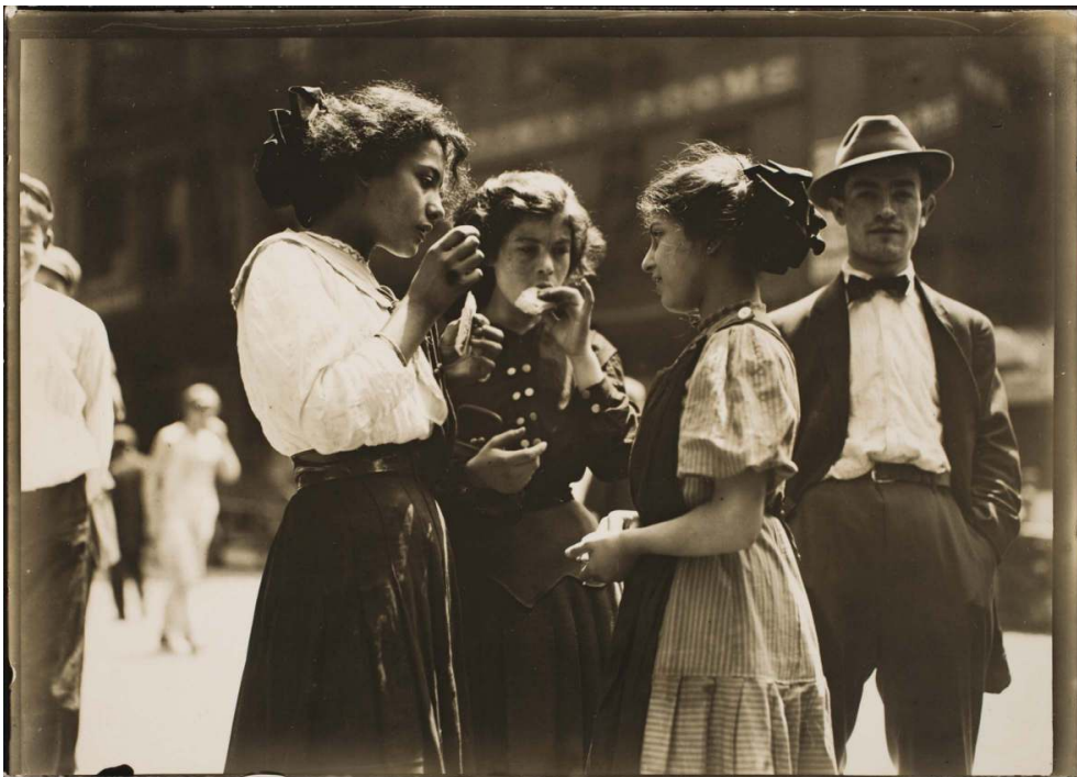
Fig. 4. L. W. Hine, « Lunchtime », tirage gélatino-argentique, 12 x 17 cm, v. 1910, coll. George Eastman House.