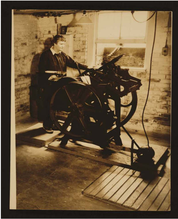
Fig. 8. B. Abbott, « Elizabeth McCausland at her printing press, ca. 1935 », 26 x 21 cm, coll. Elizabeth McCausland papers, Archives of American Art, Smithsonian Institution.