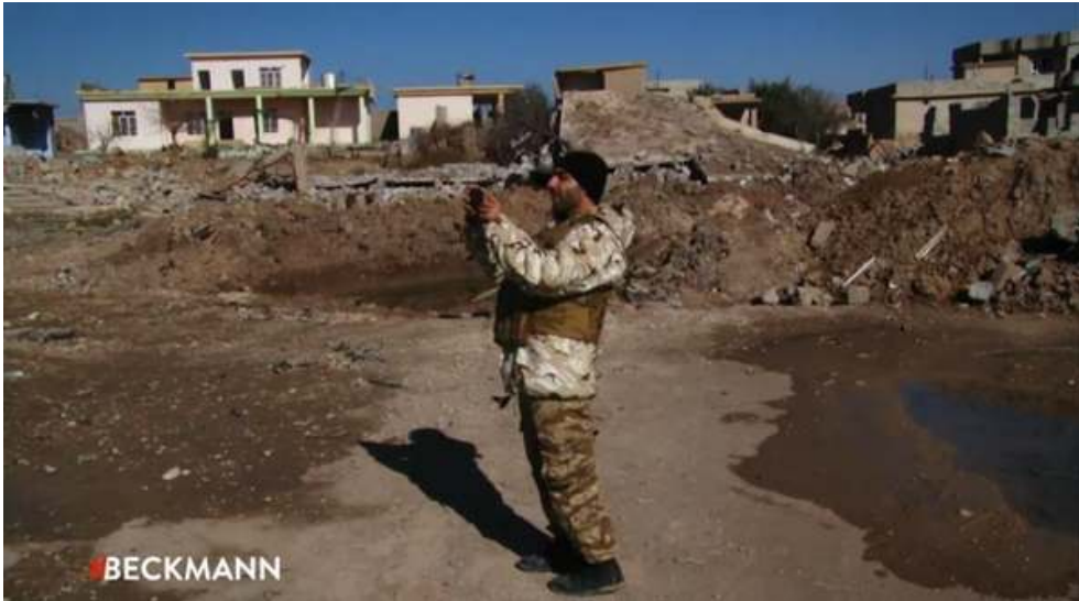
Fig. 1 et 2. Reinhold Beckmann, photogramme extrait de l'émission Unser Krieg ? Deutsche Kämpfer gegen US-Terror , diffusée le 23 février 2015 sur ARD à 20h15.