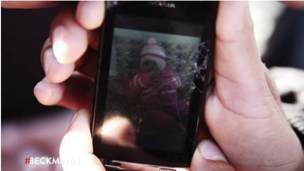
Fig. 3 et 4. Reinhold Beckmann, photogramme extrait de l'émission Unser Krieg ? Deutsche Kämpfer gegen US-Terror , diffusée le 23 février 2015 sur ARD à 20h15.