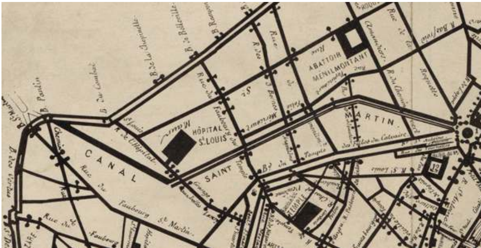
Fig. 5. Plan des barricades élevées pendant l'insurrection de juin 1848 (détail : dans le quartier du faubourg du Temple), 25 x 31 cm, planche s. n. d'éditeur, Paris, Bibliothèque nationale de France, GED-1761.