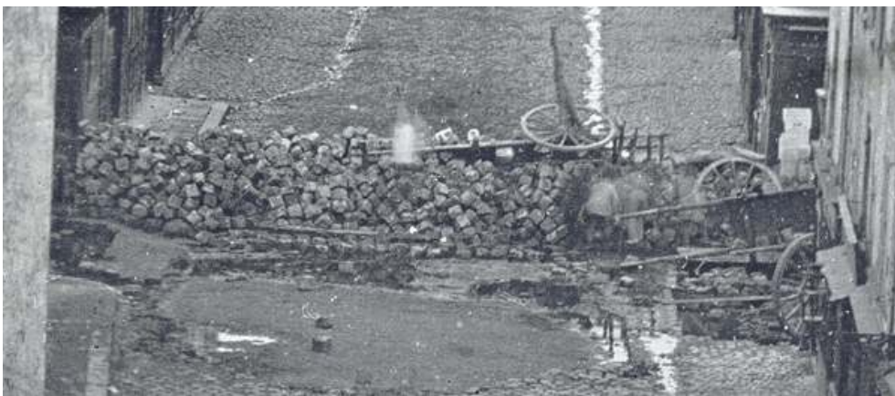
Fig. 7. Barricades rue Saint-Maur. Avant l'attaque, 25 juin 1848 (détail). Paris, musée d'Orsay.