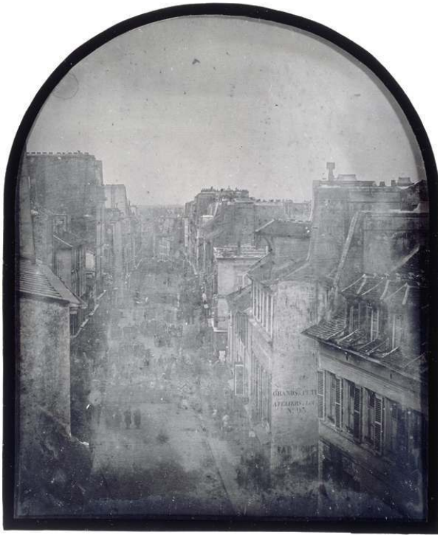
Fig. 4. Barricades rue Saint-Maur. Après l'attaque, 26 juin 1848. Daguerréotype par Thibault, 11,2 x 14,5 cm, Paris, musée d'Orsay.