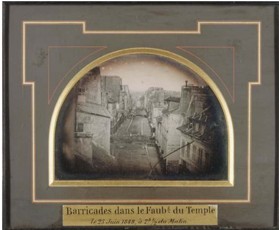
Fig. 1. Eugène Thibault, Barricades dans le faubourg du Temple, le 25 juin 1848 , daguerréotype (11,2 x 14,5 cm) donné par M. Luttringer au musée Carnavalet en 1934. La photographie est rarement reproduite. On lui préfère deux autres clichés du même auteur resté inconnu conservés, eux, par le musée d'Orsay.