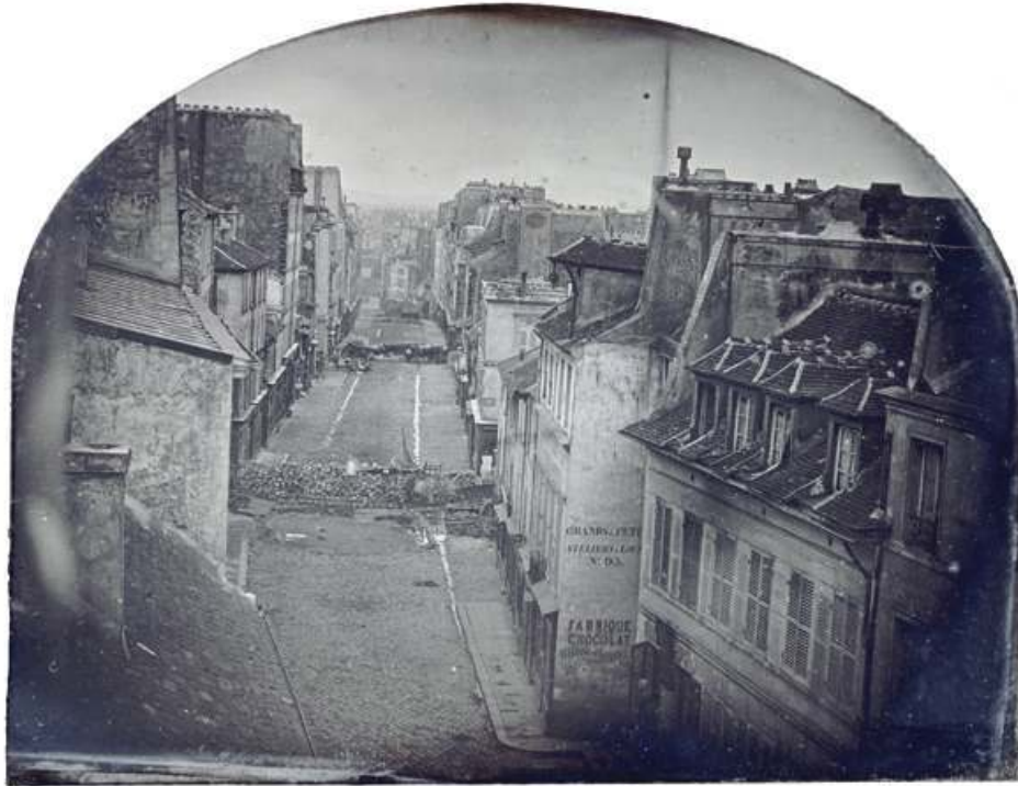
Fig. 3. Barricades rue Saint-Maur. Avant l'attaque, 25 juin 1848. Daguerreotype par Thibault, 11,2 x 14,5 cm, Paris, musée d'Orsay.