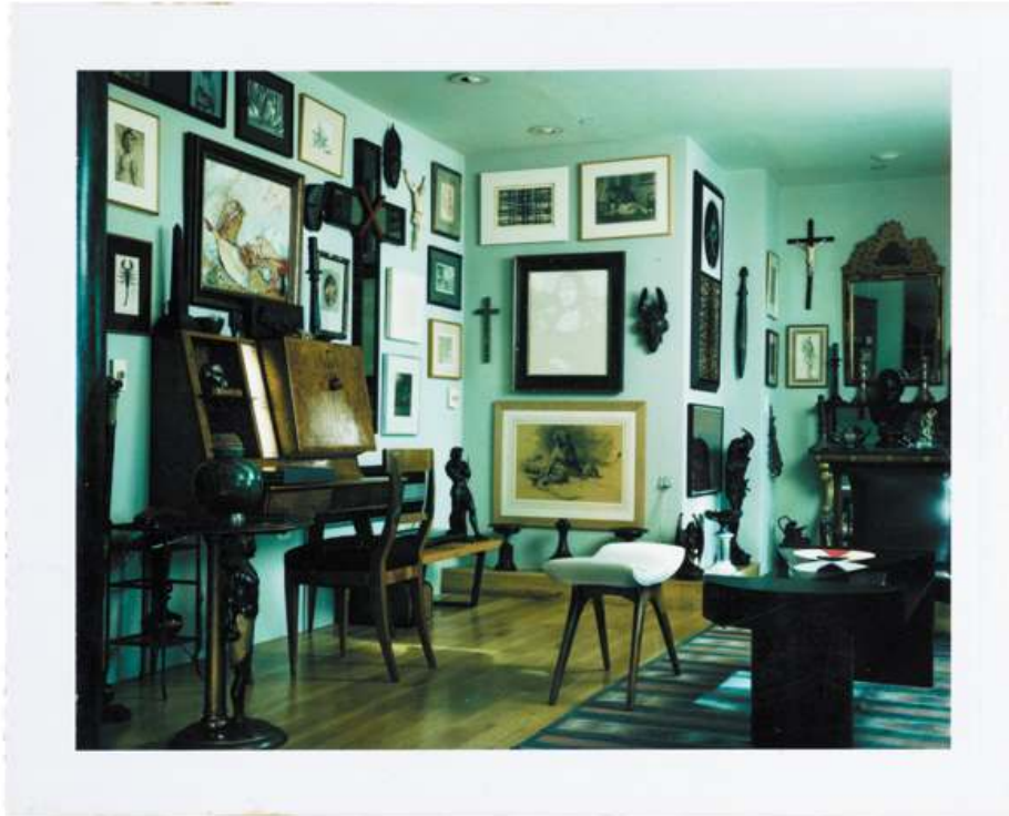
Fig. 9. Robert Mapplethorpe, Leatherman #1 , 1970, technique mixte, 24 x 17,1 cm. Acquis conjointement par le J. Paul Getty Trust et le Los Angeles County Museum of Art. Don partiel de la Robert Mapplethorpe Foundation; achat partiel avec les fonds du J. Paul Getty Trust et de la David Geffen Foundation. © R. Mapplethorpe Foundation.

sexuellement explicites 15 . Au GRI, on retrouve d'ailleurs l'idée d'anonymat dans diverses œuvres que Mapplethorpe signe par un simple « X » (fig. 11).