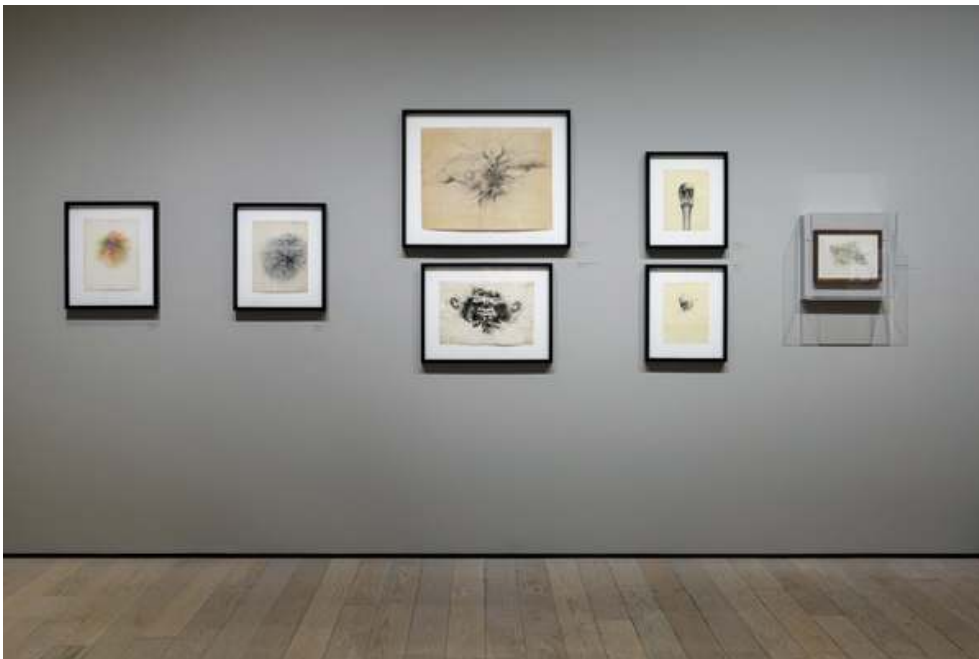
Fig. 10. Vue de l'exposition « Robert Mapplethorpe : The Perfect Medium », du 20 mars au 31 juillet 2016, Los Angeles County Museum of Art (Los Angeles, USA). Œuvre : © R. Mapplethorpe Foundation.