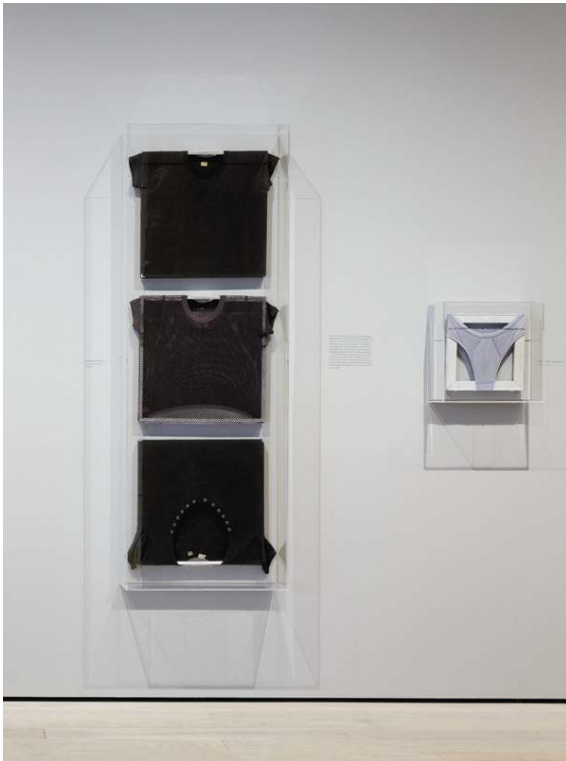
Fig. 6. Vue de l'exposition « Robert Mapplethorpe : The Perfect Medium », du 20 mars au 31 juillet 2016, Los Angeles County Museum of Art (Los Angeles, USA). Œuvre : © Robert Mapplethorpe Foundation.