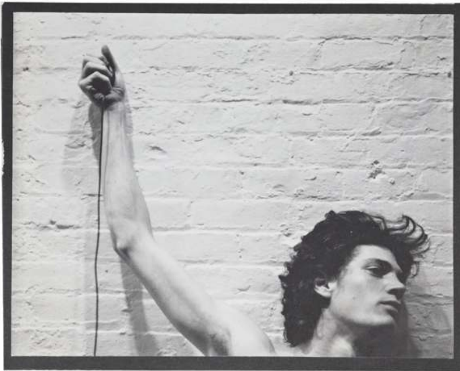
Fig. 1. Robert Mapplethorpe, Self-Portrait, 1974, tirage argentique depuis un négatif Polaroid (produit en plusieurs exemplaires). Don de la Robert Mapplethorpe Foundation au J. Paul Getty Trust et au Los Angeles County Museum of Art.

légué par la R. Mapplethorpe Foundation il y a maintenant cinq ans. Chez un artiste dont l'œuvre gagne à être reconsidérée, ils inaugurent un champ d'étude inédit.