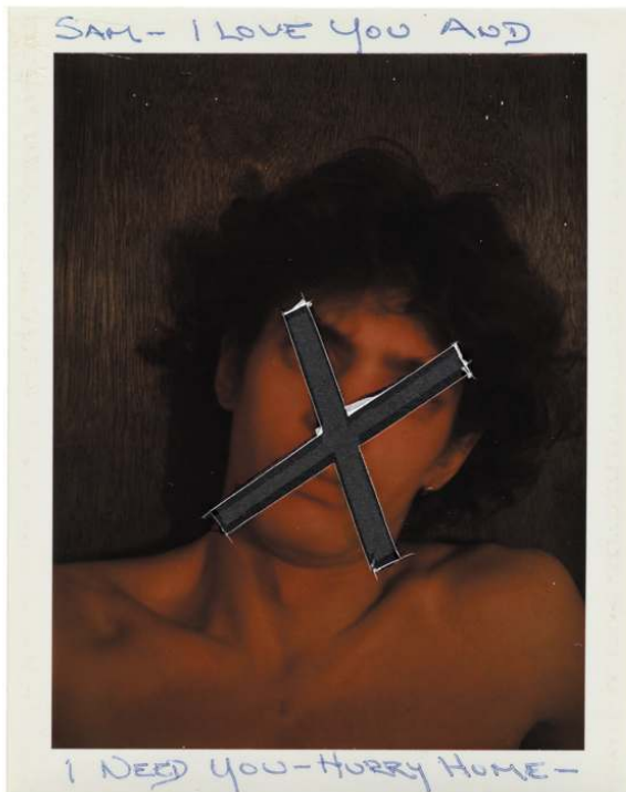
Fig. 11. Robert Mapplethorpe, Untitled (“Sam – I love you and I need you – hurry home”), 1974, tirage Polaroid couleur modifié. Don de la Robert Mapplethorpe Foundation au J. Paul Getty Trust et au Los Angeles County Museum of Art.