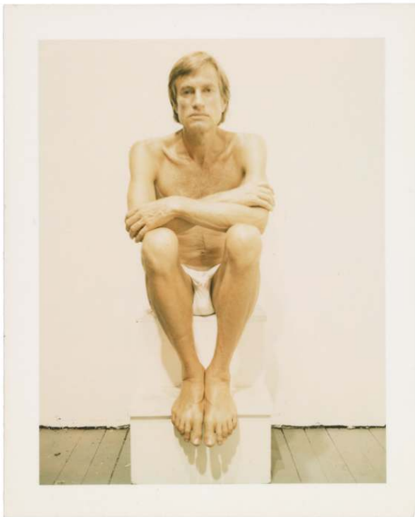
Fig. 2. Robert Mapplethorpe, Sam Wagstaff , vers 1972, tirage Polaroid couleur, 13,3 × 10,8 cm. Don de la Robert Mapplethorpe Foundation au J. Paul Getty Trust et au Los Angeles County Museum of Art.