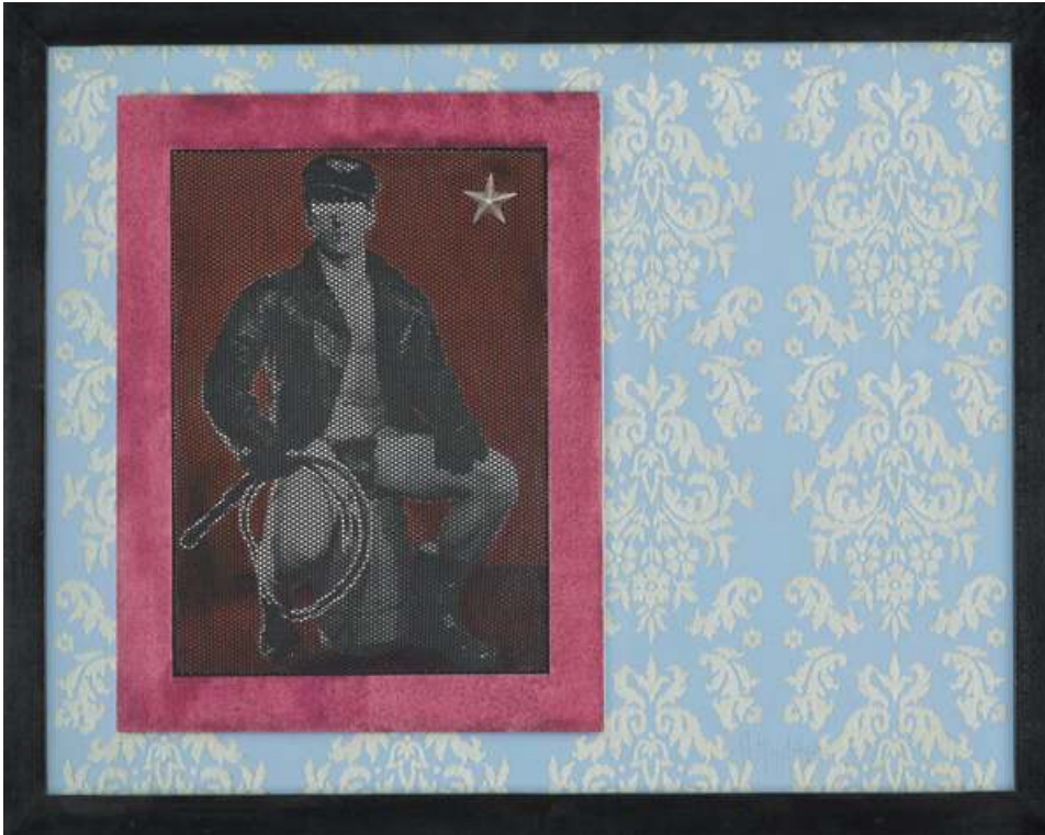
FIG. 8. ROBERT MAPPLETHORPE, POLAROID TEST SHORT OF THE INTERIOR OF MAPPLETHORPE'S WEST TWENTY-THIRD STREET LOFT, TAKEN FOR HOUSE & GARDEN, JUNE 1988.