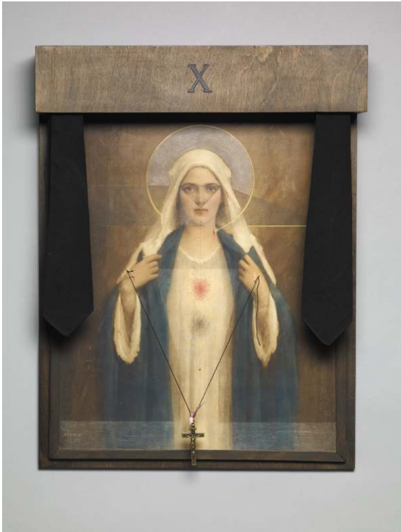
Fig. 7. Robert Mapplethorpe, Tire Rack , 1969, Chromolithographie, crayon de couleur, contreplaqué teinté, Plexiglas, crucifix en métal, fil noir, aiguilles et cravates noires, cadre réalisé par l'artiste. Acquis par le J. Paul Getty Trust et le Los Angeles County Museum of Art. Don partiel de la Robert Mapplethorpe Foundation; achat partiel avec les fonds du J. Paul Getty Trust et de la David Geffen Foundation. Œuvre : © R. Mapplethorpe Foundation.