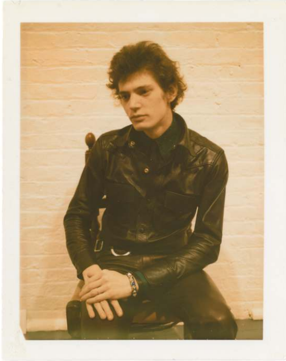
Fig. 3. Robert Mapplethorpe, Self-Portrait, vers 1973, tirage Polaroid couleur. Don de la Robert Mapplethorpe Foundation au J. Paul Getty Trust et au Los Angeles County Museum of Art.