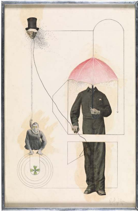
Fig. 4. Robert Mapplethorpe, Untitled , 1968, collage sur papier et graphite, crayon de couleur, fil et pastel, cadre réalisé par l'artiste. Don de la Robert Mapplethorpe Foundation au J. Paul Getty Trust et au Los Angeles County Museum of Art.

et des assemblages de type très divers – des collages, des travaux mixed-media , tout comme des installations.