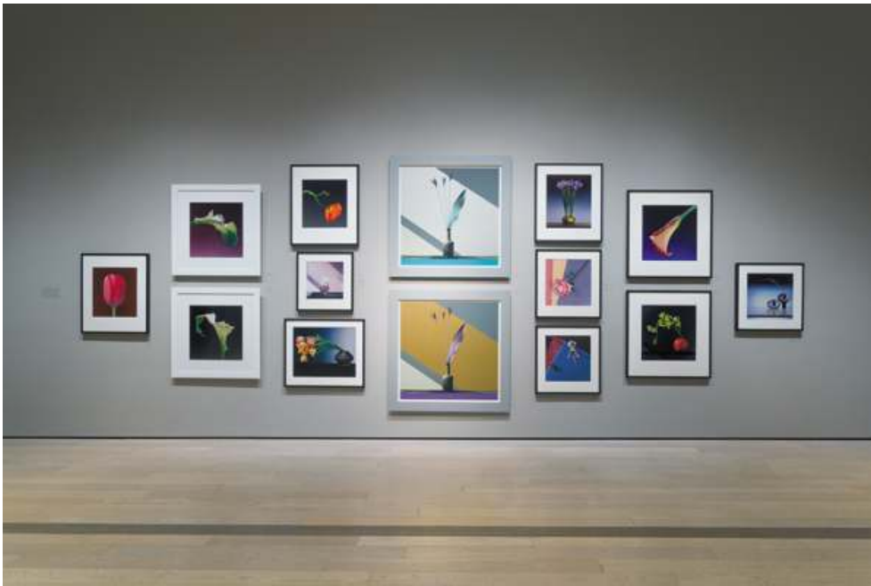
Fig. 16. Vue de l'exposition « Robert Mapplethorpe : The Perfect Medium », du 20 mars au 31 juillet 2016, Los Angeles County Museum of Art (Los Angeles, USA). Œuvre : © R. Mapplethorpe Foundation.