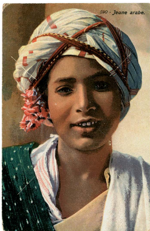
Fig. 5. Lehnert et Landrock, « Jeune arabe », carte postale n°590, 13,8 x 8,9 cm, avant 1921, coll. P. et M. Centlivres.