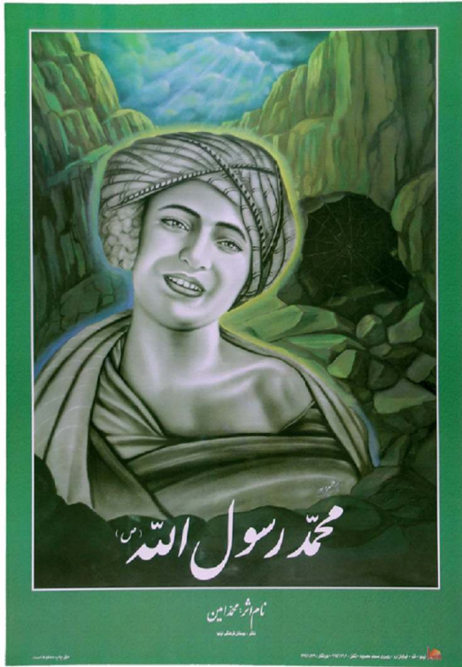
Fig. 8. « Mohammad, l'Envoyé de Dieu », affiche imprimée à Qom (Iran), 49 x 34 cm, acquise en 2003, n°2624 de la coll. P. et M. Centlivres.