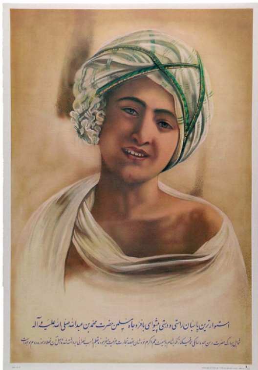
Fig. 7. Portrait de Mahomet jeune, affiche imprimée à Téhéran, 49,5 x 34,5 cm acquise en nov. 1998, coll. P. et M. Centlivres.