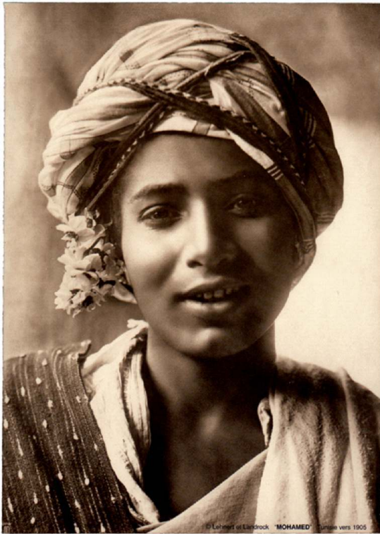
Fig. 2. Carton d'invitation de l'exposition « Lehnert et Landrock. Photographies orientalistes 1905-1930 », galerie Au Bonheur du jour, 26 mai au 3 juillet 2004.