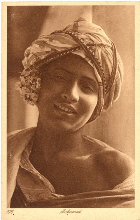
Fig. 4. Lehnert et Landrock, « Mohamed », carte postale n°106, 14 x 8,9 cm, envoyée en 1921, coll. P. et M. Centlivres.