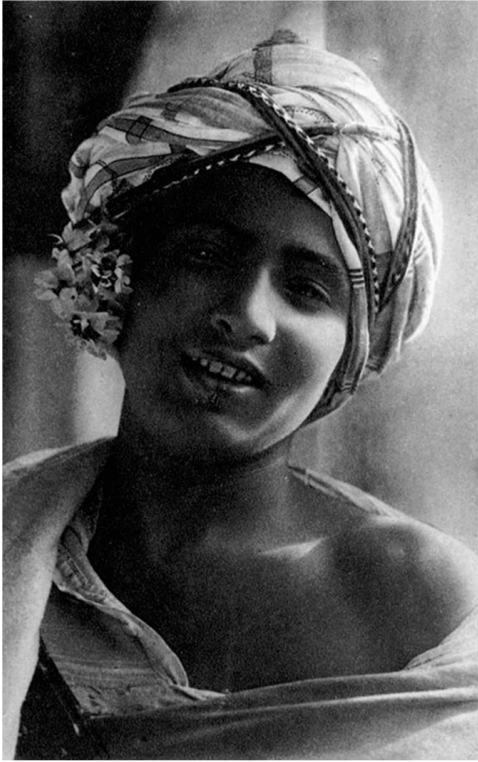
Fig. 3. Lehnert et Landrock, portrait de jeune homme, tirage moderne d'après un négatif original, 22 x 16 cm, v. 1905-1906, coll. musée de l'Elysée, Lausanne