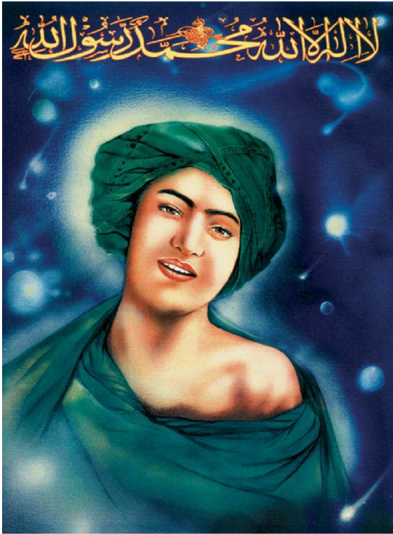
Fig. 1. Portrait de Mohomet jeune, affiche imprimée à Téhéran, 30,5 x 20,5 cm, acquise à Téhéran à l'été 2004, coll. Sabrina Mervin.