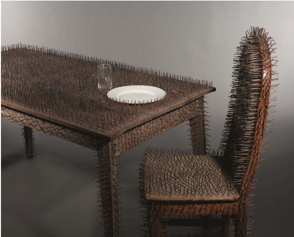
Julien Vignikin, Le Dîner des fantômes , 2012-Bois, métal, verre, porcelaine et clous H:120cm; L:170 cm environ. Collection particulière