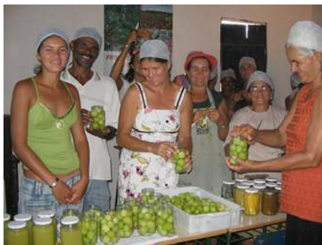
Figura 3. Armazenamento e Aproveitamento das Frutas Excedentes

Paralelamente ao aumento da produção de frutas, verduras e leguminosas, os agricultores foram incentivados e orientados a articular-se em associações, para promover a venda de produtos excedentes. Com o apoio do IPB na elaboração de projetos, as associações criadas conseguiram adquirir galpões para uso compartilhado, assim como máquinas despoldadeiras, visando comercializar parte dos seus produtos já “industrializados”, na forma de polpas de suco e geleias, buscando aumentar a renda familiar e evitar desperdícios, conforme demonstra a Figura 3.