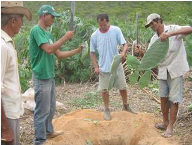
Figura 5. Agricultores picando palma, planta típica da Caatinga, composta por cerca de 90% de água, para o preparo do solo

Uma das técnicas aplicada foi a utilização da palma e do mandacaru, plantas típicas da Caatinga, picadas em pedaços pequenos e sendo colocadas em buracos ao lado de outra cultura (conforme Figura 5). Desta forma, a palma e o mandacaru, que armazenam naturalmente muita água, cedem parte de sua reserva para outras plantas.