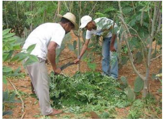
Figura 6. Agricultores realizando a cobertura do solo

A técnica de realizar a cobertura do solo (demonstrada na Figura 6) foi comprovada pelos participantes do Projeto como altamente eficaz para reduzir a quantidade de água necessária para irrigação e aumentar a produtividade. Os agricultores utilizam resto de culturas (como palha de milho, mamona e feijão, assim como resíduo do sisal) para colocar sobre o solo e ao redor do caule das plantas. O objetivo dessa técnica é formar cobertura vegetal densa, rica em nutrientes e material orgânico, que cumpre duplo objetivo: nutrir o solo, dispensando a utilização de fertilizantes industriais, e baixar a temperatura do solo, reduzindo a evaporação.