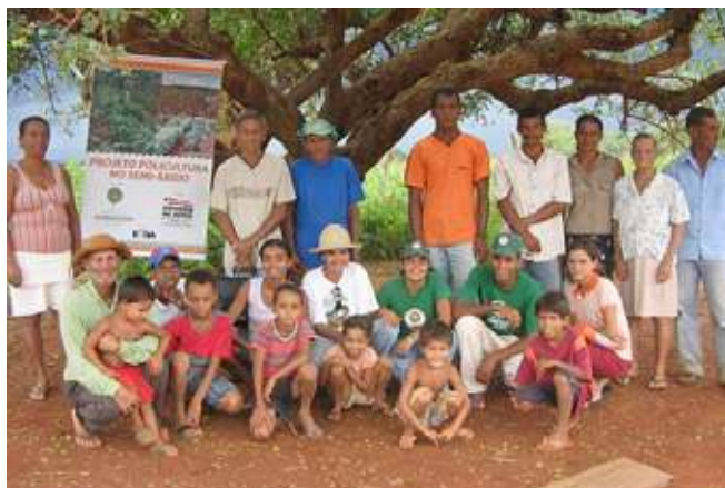
Figura 4. Agricultores e Seus Familiares Integrantes do Projeto

Verificou-se que o capital social (confiança estabelecida entre os atores) foi estimulado, tanto que o plantio e o manejo dos campos de Policultura foram realizados, na maioria das vezes, em mutirões. Também a comercialização dos produtos excedentes foi realizada de forma coletiva, através de uma das associações criadas a partir do projeto.