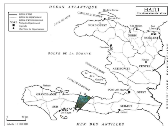
Figure 1. Localisation du projet de Madian-Salagnac

Jeunesse Agricole Chrétienne (JAC) et du syndicalisme agricole des années 60 en Bretagne.