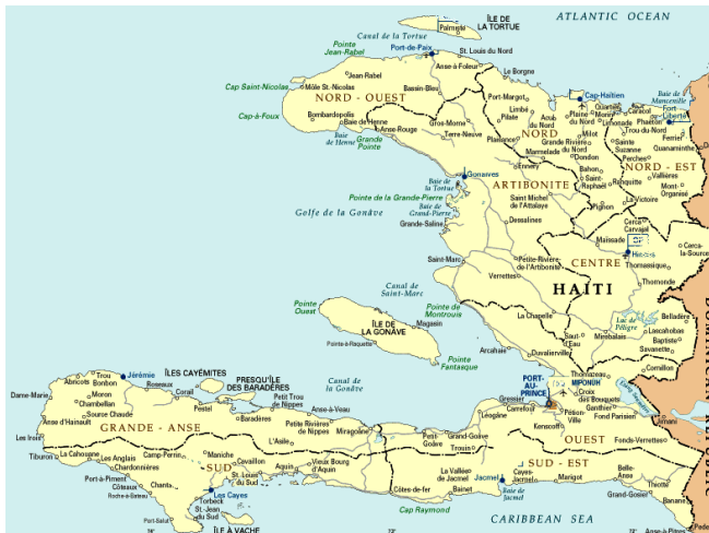
Figure 1. Carte des zones d'enquêtes