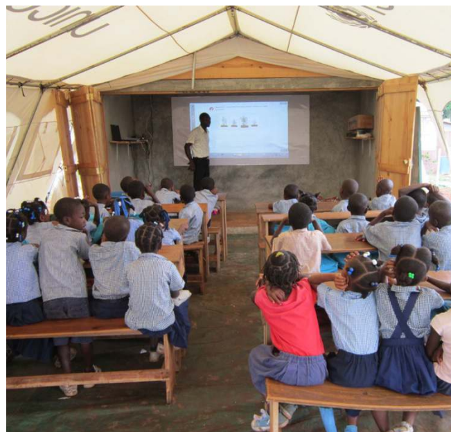
Figure 3. Cours numérique dans une école sous tente après le séisme à La Montagne de Jacmel

L'équipement devait se faire de façon progressive: 12 au moins la première année, 30 à l'issue de la 2 ème année et 60 à l'issue de la 3 ème année. Ceci devait donner le temps de former des installateurs et surtout des techniciens chargés de la maintenance (1 par zone). Le plan d'installation prévoyait de le faire par grappes successives : zone de Port-au-Prince, zone des Cayes, zone de Jacmel, zone de Jérémie.