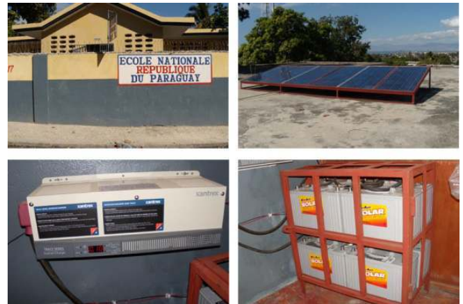
Figure 4. Installation d'électrification solaire-pilote à l'école Nationale de la République du Paraguay

batteries, main d'œuvre et transport) s'est élevé à $6 200.