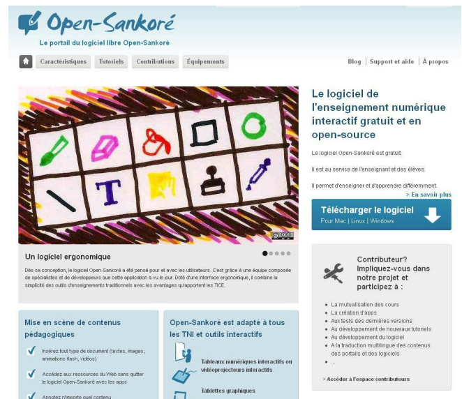
Figure 2. Site internet du programme Sankoré

en cours d'élaboration dans les pays d'Afrique et de l'Océan Indien. La DIENA s'est engagée à soutenir Haïti Futur par des dons de matériel en allant jusqu'à faire entrer Haïti dans les pays bénéficiaires du programme, ce qui n'était pas prévu à l'origine.