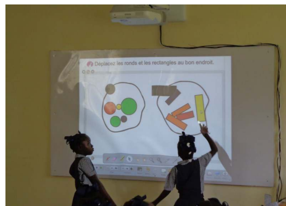
Figure 1. Classe faite avec l'aide du TNI

Le pays a donc choisi de ne pas investir dans l'éducation alors que la pression démographique (3.5% en 2010, parmi les plus élevés de la Région) ne fait qu'accroître davantage la demande de ressources pour le secteur éducatif. Comment s'étonner dès lors que