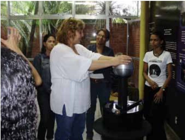
Figura 3. Professores do mini-curso interagindo com o módulo “Eletricidade e Magnetismo”.

absolutas. Contudo, sabemos que a geração e a comunicação de conhecimento são cada vez maiores e mais ágeis, principalmente com o advento da internet . (Zamboni, 2001). Em decorrência das constantes atualizações de informações e conhecimento, a formação inicial dos professores por si só, acaba não sendo suficiente ao educador, ao longo de sua vida profissional. Por isso, é de grande valia que o professor participe de programas de formação continuada de professores.