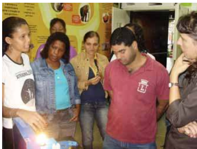
Figura 2. Professores do curso de capacitação interagindo com o módulo “Consumo de Energia”

realidade da Baixada Fluminense, apresentando por último, vídeos que tratavam de alguns temas abordados na exposição.