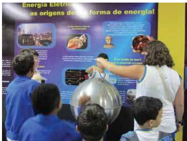
Figura 1. Exposição “Energia e Vida”