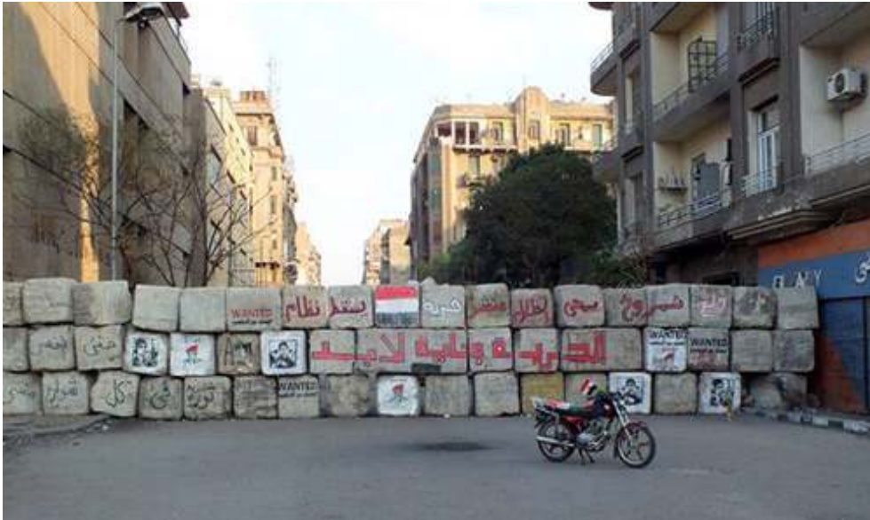
Figure 3 – Une barricade proche de la place Tahrir, décembre 2011