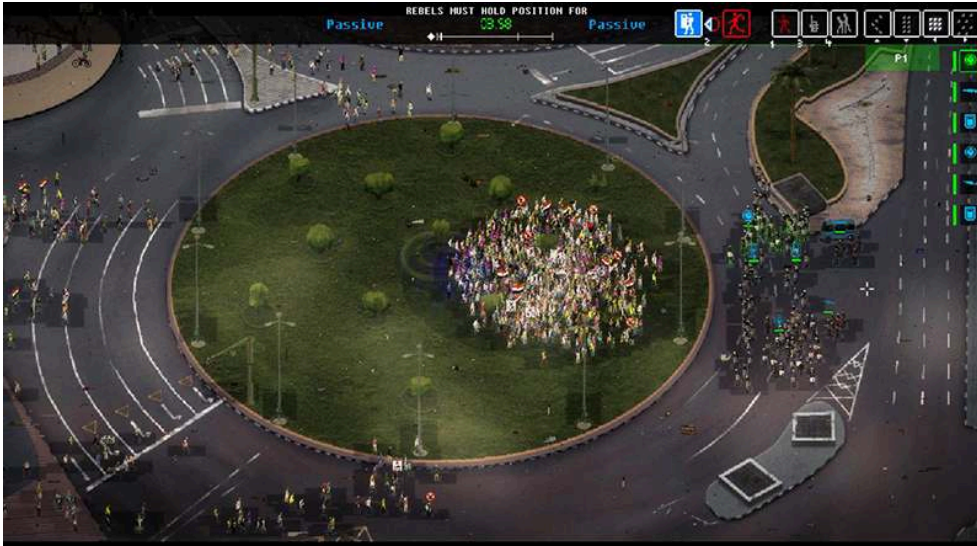
Figure 6 – Capture d'écran réalisée par les auteurs de l'article de la place Tahrir recréée dans le jeu Riot: Civil Unrest