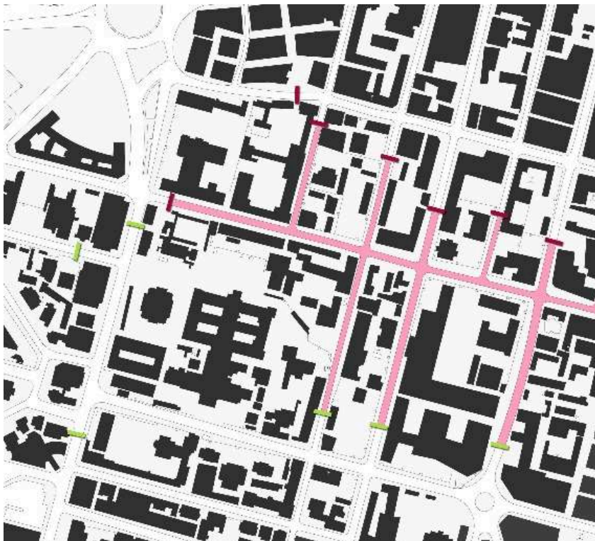
Figure 2 – Carte montrant comment la police crée les barricades pour contrôler l'espace