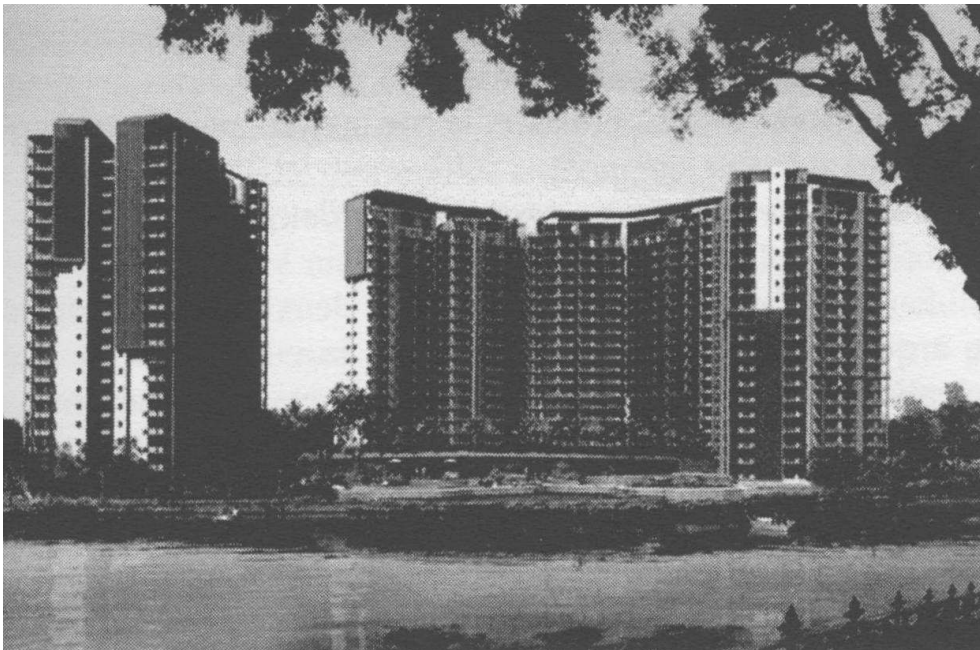
Vue depuis la rive nord-est du plan d'eau