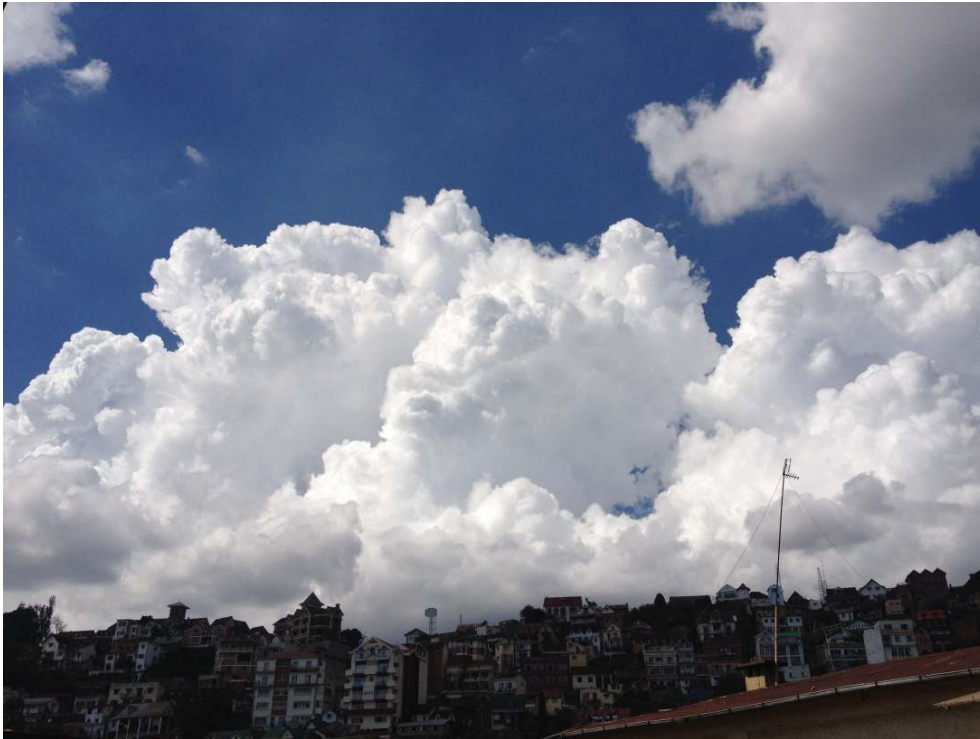
Figure 4 : Cumulonimbus en formation, Antananarivo