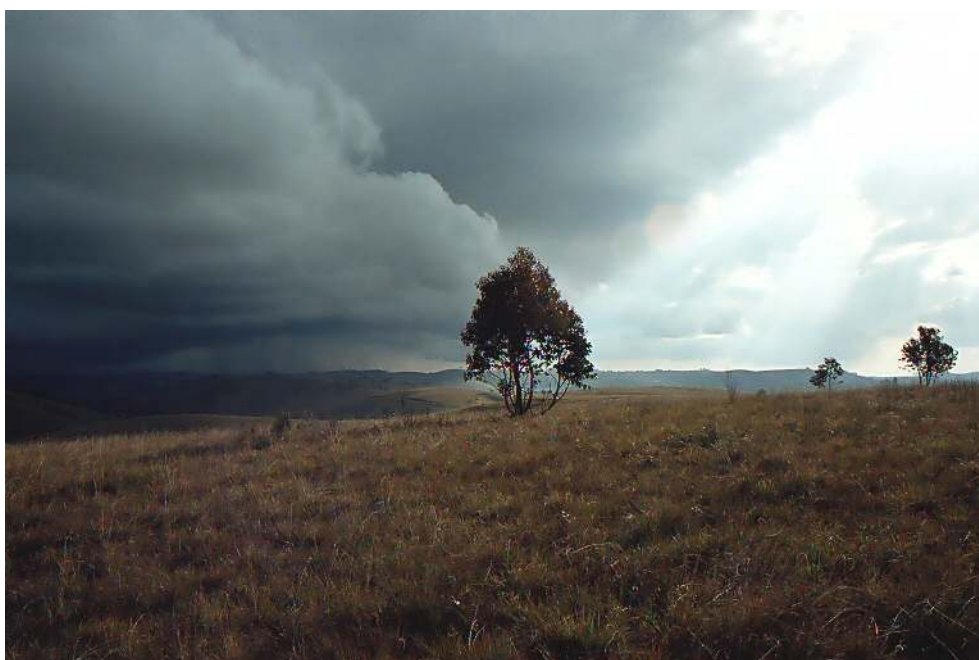
Figure 3 : L'approche d'un orage de grêle en Imerina centre-oriental

clairement que ces petits cumulus sont condamnés à s'étaler plutôt qu'à se développer verticalement et, par conséquent, à ne pas donner de précipitations. N'eût été l'heure assez avancée de la journée, cette qualification nuageuse aurait pu rendre sceptique n'importe quel météorologue dans la mesure où un tel nuage a, en situation d'instabilité atmosphérique telle qu'elle l'était ce jour-là, toute chance d'atteindre le stade de cumulus mediocris (extension verticale pouvant être assez importante) ; ne croyant pas au hasard de cette réponse, il nous fût donc donné de constater une appréciation particulièrement fine, voire experte à certains égards, des conditions météorologiques locales de la part de cet habitant.