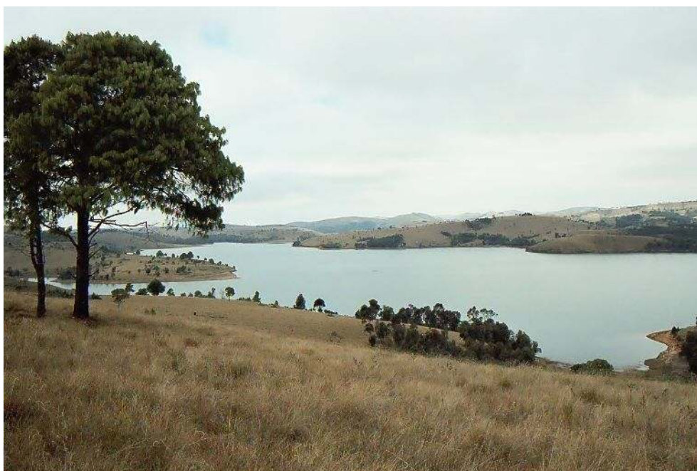
Figure 2 : Entre nuage mitataorahona , lac de Tsiazompaniry , et terres défrichées de l'est merina