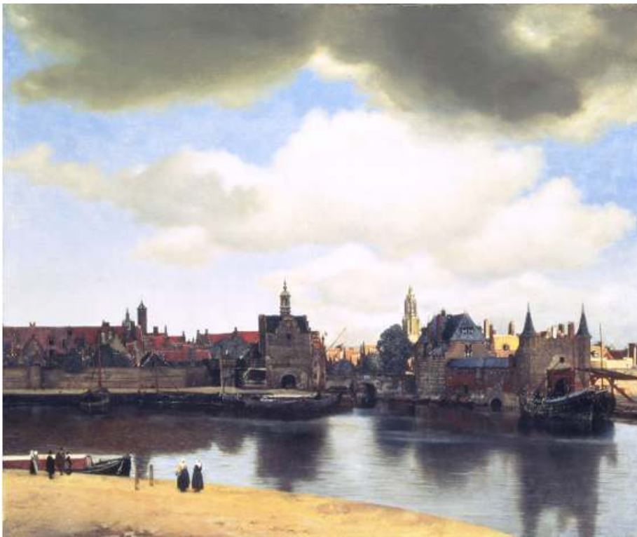
Royal Gallery Mauritshuis