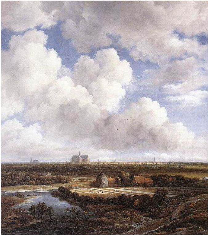
Figure n° 4 : Jacob van Ruisdael, Vue de Haarlem , vers 1670