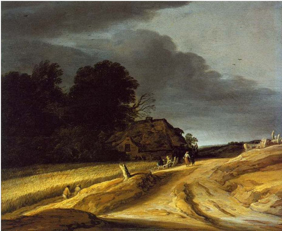
Figure n° 5 : Pieter van Santvoort, Paysage avec un chemin et une ferme , 1625

Staatliche Museen Preussischer Kulturbesitz