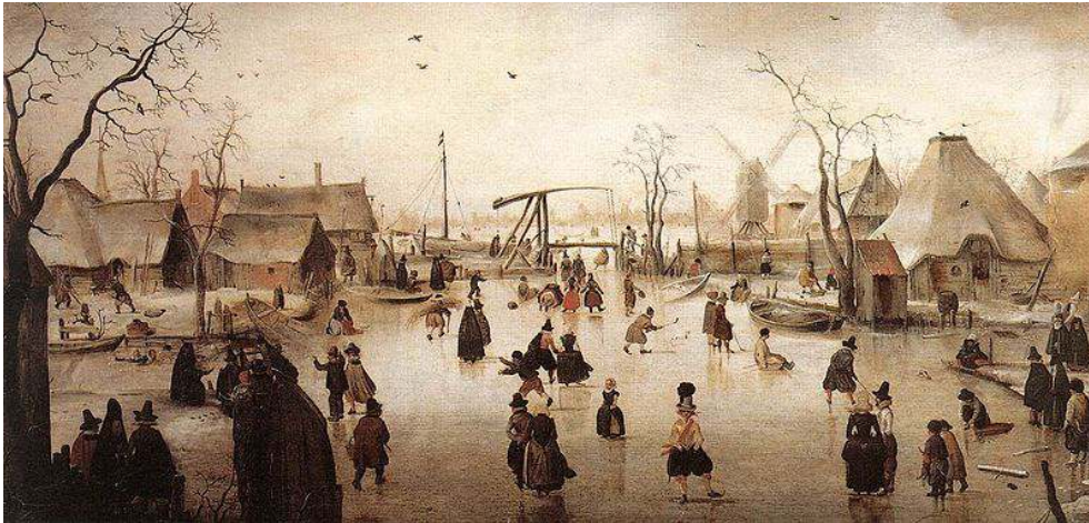
Figure n° 2 : Hendrick Avercamp, Scène d'hiver , vers 1610