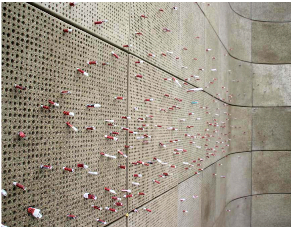
Figure 1 – Mur du patio des enfants. Los Angeles Museum of the Holocaust

8 avril 2013, jour de Yom Hashoah