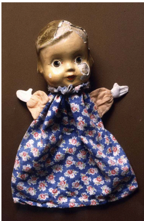
Figure 2 – La poupée de Zosia Zajczyk