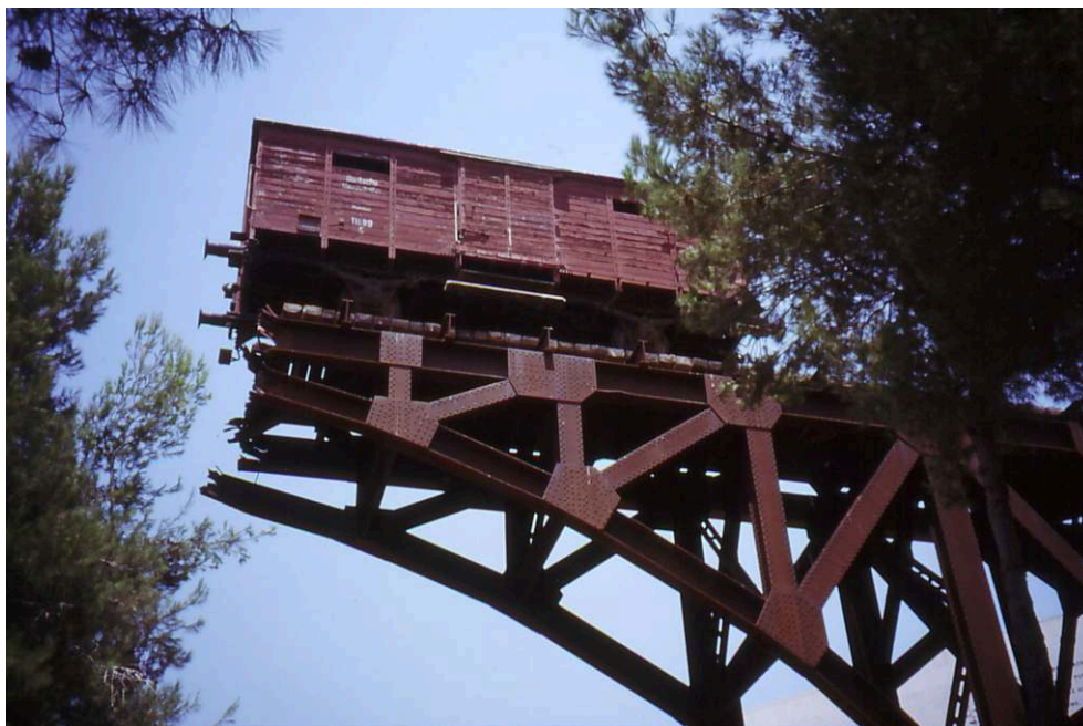
Figure 3 – Le Mémorial pour les Déportés. Yad Vashem

Cliché : Dominique Chevalier, novembre 2008